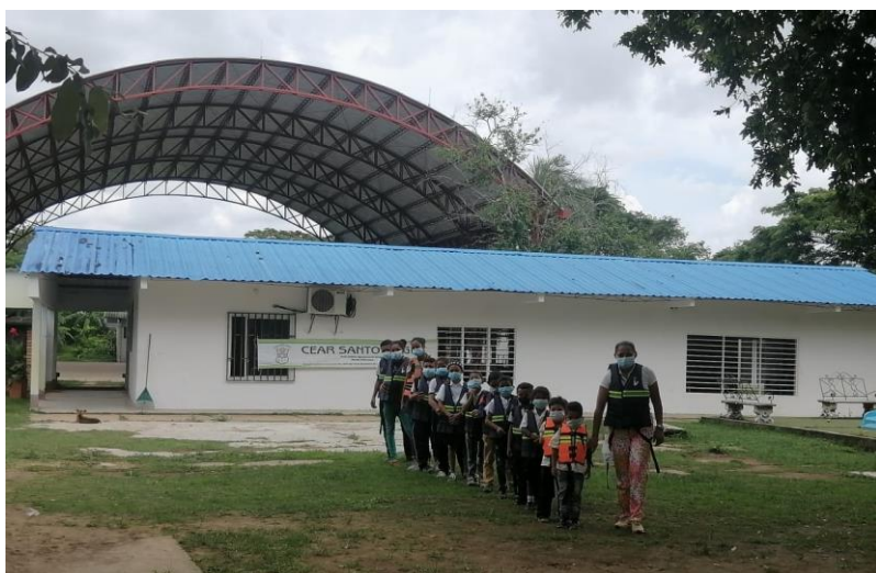
Institución Educativa Santo ángel