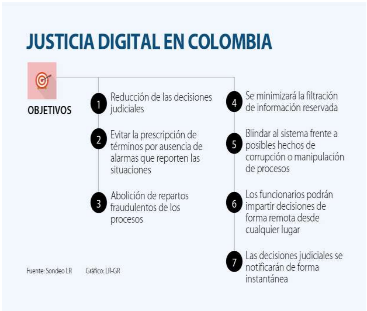
Tabla N° 1 – Justicia digital en Colombia

Para Acosta Argote (como se citó en asuntos: legales, 2021) la era digital que se está desarrollando conseguirá que el 56% de los despachos judiciales llegue a la evolución tecnológica y permitirá que el trámite de los procesos que se encuentren en su poder sea mucho más fácil, así como realizar de manera más efectiva las notificaciones judiciales a las personas intervinientes dentro de un asunto judicial, señala: