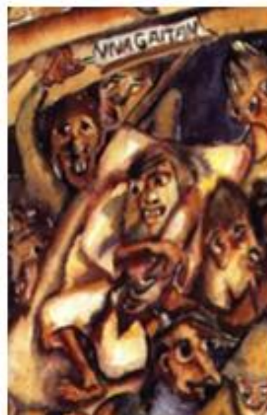
Figuras 5, 6 y 7