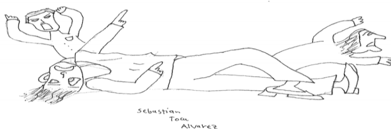
Signo de hostilidad (1)

En este cuadro podemos observar el maltrato, la violencia y el abuso hacia los derechos humanos del pueblo colombiano, vemos las expresiones de sufrimiento y angustia, el pueblo ante el caos solo evoca un llanto de auxilio, ¿pero, a quienes pedirían socorro? Si los “héroes” de la patria eran los mismo que los asesinaban sin resentimiento alguno. el caos se apodero de los corazones, que aquellos soldados solo tenían un objetivo, restablecer el orden público a punta de balas y de muerte.