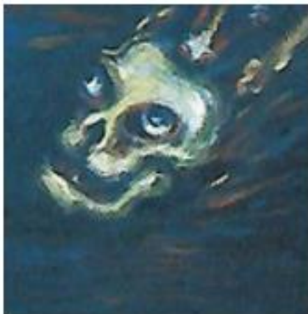
Figura 10 Autora: Débora Arango Pérez Fragmento de El cementerio de la chusma y/o mi cabeza (1951) Material – Medidas: Óleo sobre lienzo – 127 x 95 cm Colección: Museo de arte Moderno Medellín. [Pintura 2]- Calavera con ojos (artista)