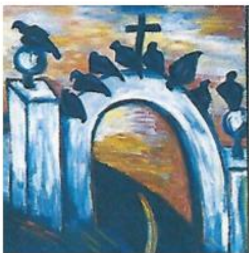
Figura 11 Autora: Débora Arango Pérez Fragmento El cementerio de la chusma y/o mi cabeza (1951)

Los cuervos que se postran en la entrada podrían ser sinónimo de mal augurio o que están anunciando la llegada de la muerte, pero lo curioso, es que hay una manada de cuervos en una sola cruz, cabe resaltar que la cruz es un símbolo religioso y que hace alusión a la fe y la creencia de algunos pueblos respecto a una deidad.