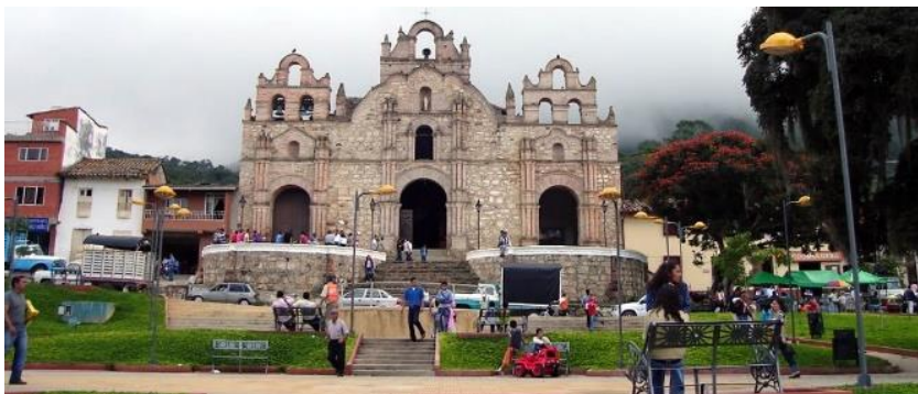
Figura 3. Parque Aratocha.

En el municipio de Aratocha, los documentos de comparendos de tránsito se allegaban a la inspección de policía por el funcionario de tránsito que lo imponía; éste en un tiempo no mayor a 6 meses realizaba el documento de sanción al contraventor, que en algunos casos se interrumpía con audiencias que podían anular el comparendo impuesto.