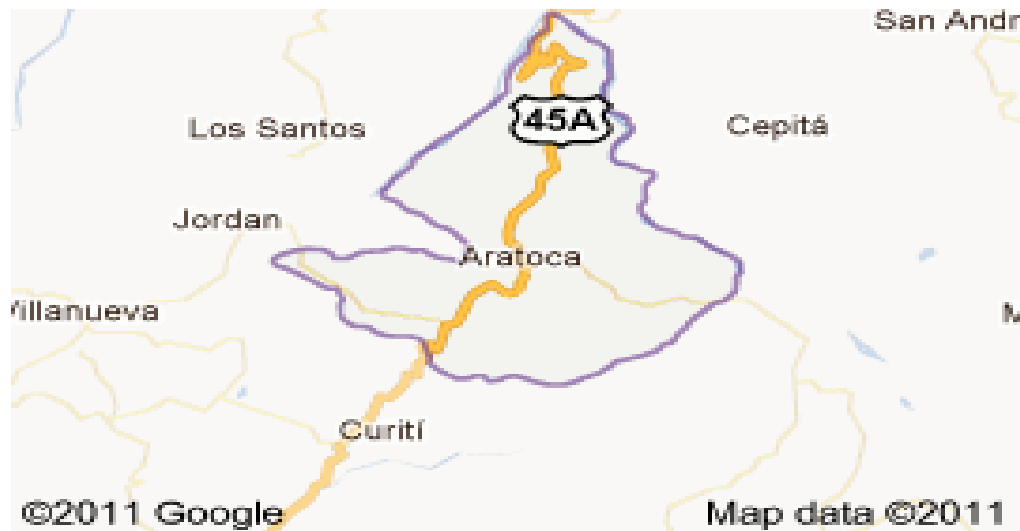
Figura 4. Aratoca, Santander. Adaptado de ESAP