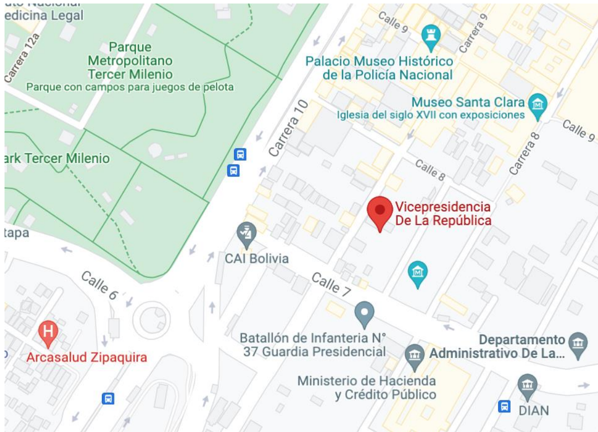
Figura 1. Ubicación geográfica de la Vicepresidencia de la República.