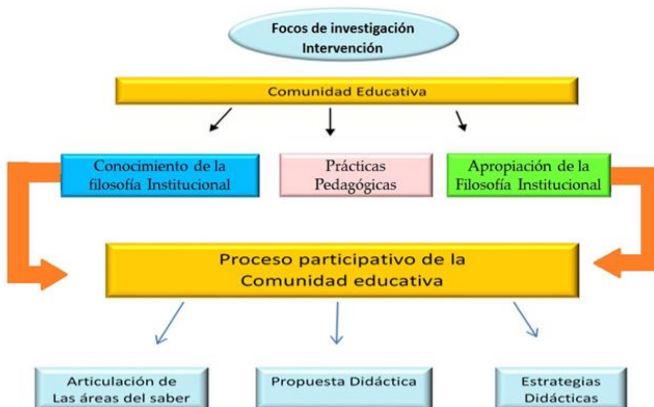
Figura N° 3. Focos de Investigación