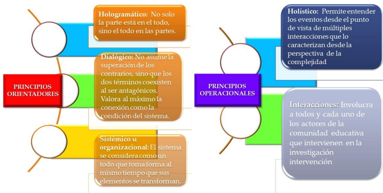
Figura N° 2. Principios claves de la complejidad

Teniendo en cuenta lo anterior, en la figura N° 2 se pueden observar algunos principios claves de la complejidad que sustentan el proyecto.