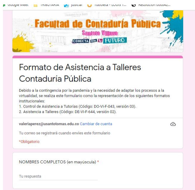
Figura 3. Formatos de asistencia de talleres

En las siguientes imágenes se pueden presenciar los dos formatos que maneje en las pasantías para la toma de asistencia y la evaluación de los talleres de Accountant buddy con los cual se recolecta la información para llenar el cuadro maestro,