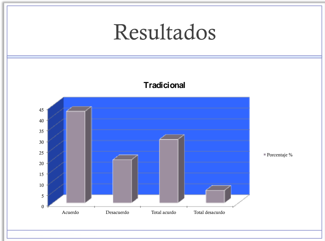
Grafica 1 Modelo pedagógico tradicional en la Institución Educativa Los Ángeles.

En la Institución Educativa Los Ángeles, se evidencia una marcada inclinación por el modelo pedagógico tradicional con respecto de los otros modelos, teniendo en cuenta las respuestas interpretadas en el instrumento.