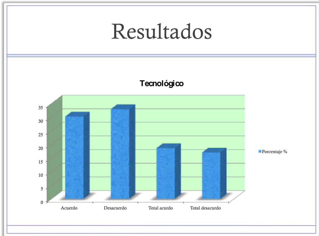
Grafica 2 Modelo pedagógico tecnológico en la Institución Educativa Los Ángeles.

Este modelo pedagógico Tecnológico (Conductista) en la institución educativa los Ángeles, tiene una gran afinidad de acuerdo con la ponderación obtenida; a lo cual se le puede dar una explicación que surge desde la misma política educativa nacional y sus lineamientos curriculares, los cuales tiempo atrás respondieron a una educación por Logros, luego a una educación por objetivos y hoy por hoy por competencias.