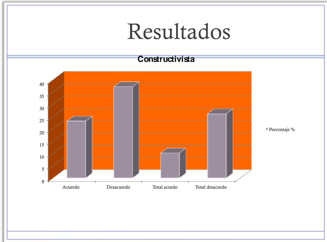
Grafica 3. Modelo pedagógico constructivista en la Institución Educativa Los Ángeles

No se puede desconocer que el instrumento arroja como resultado un menor número de respuestas inclinadas hacia este tipo de modelo pedagógico en comparación con los otros modelos, en este contexto se podría decir que en la Institución Educativa Colegio Los Ángeles, existe una limitada tendencia, al reconocer en los estudiantes disposiciones a la hora de entablar relaciones entre comunidad educativa, conocimientos e interés propios.