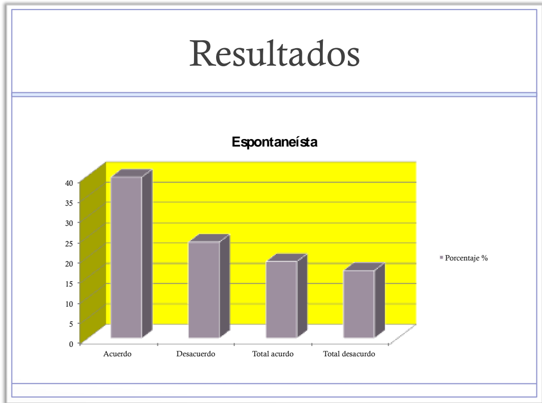
Grafica 4. Modelo pedagógico Espontaneísta en la Institución Educativa Los Ángeles

En la interpretación de este modelo pedagógico, se puede percibir una alta afinidad, lo que resulta contradictorio dado que como ya se vio el modelo predominante es el tradicional.