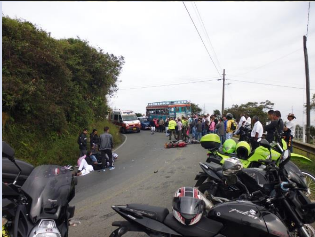
El alto flujo vehicular, asociado a las deficiencias técnicas de la vía, genera riesgos inminentes de accidentes. (vía de los Embalses, sector Brisas del Río)