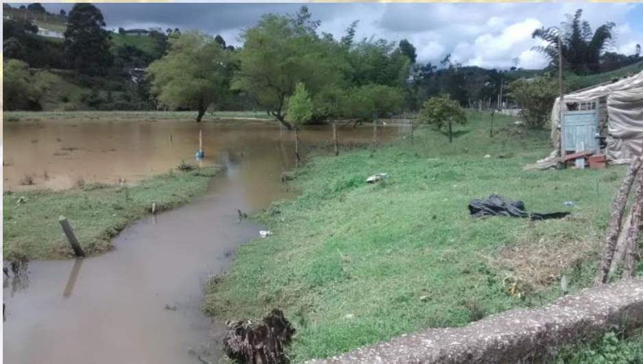
Inundación vereda El Recodo

Integrantes del CMGRD responsables de elaborar la respectiva caracterización: Secretario de Planeación y demás miembros del comité de gestión del riesgo en el municipio.