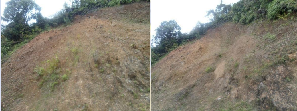
Taludes erosionados en la margen XXX de la vía...

La conformación de la vía en medio de taludes con cortes verticales asociados a la alta pendiente de la zona, propicia que de manera permanente se produzcan deslizamientos de los mismos que caen sobre la banca de la carretera, interfiriendo el paso del flujo vehicular, esto es común en épocas de invierno.