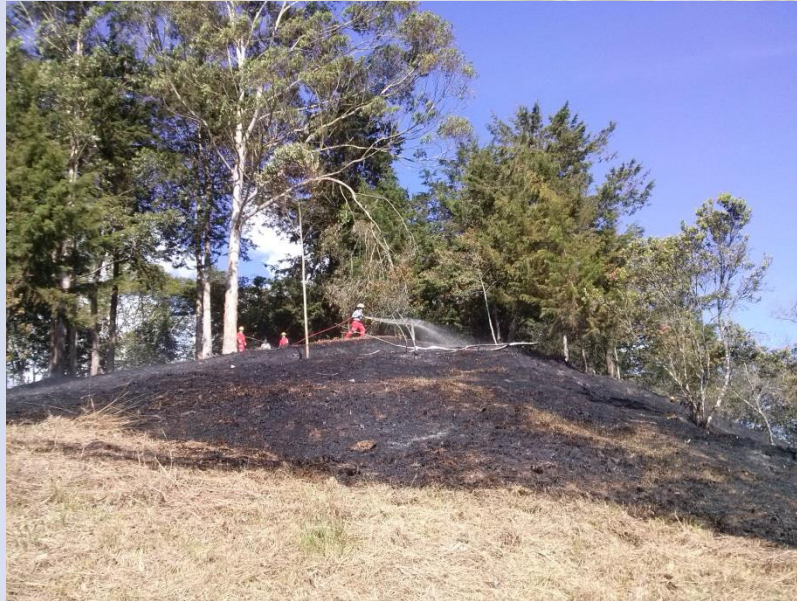
Incendio sector Tinajas UPB

Integrantes del CMGRD responsables de elaborar la respectiva caracterización (Formularios 1 a 5): Secretario de Planeación y demás miembros del comité de gestión del riesgo en el municipio.