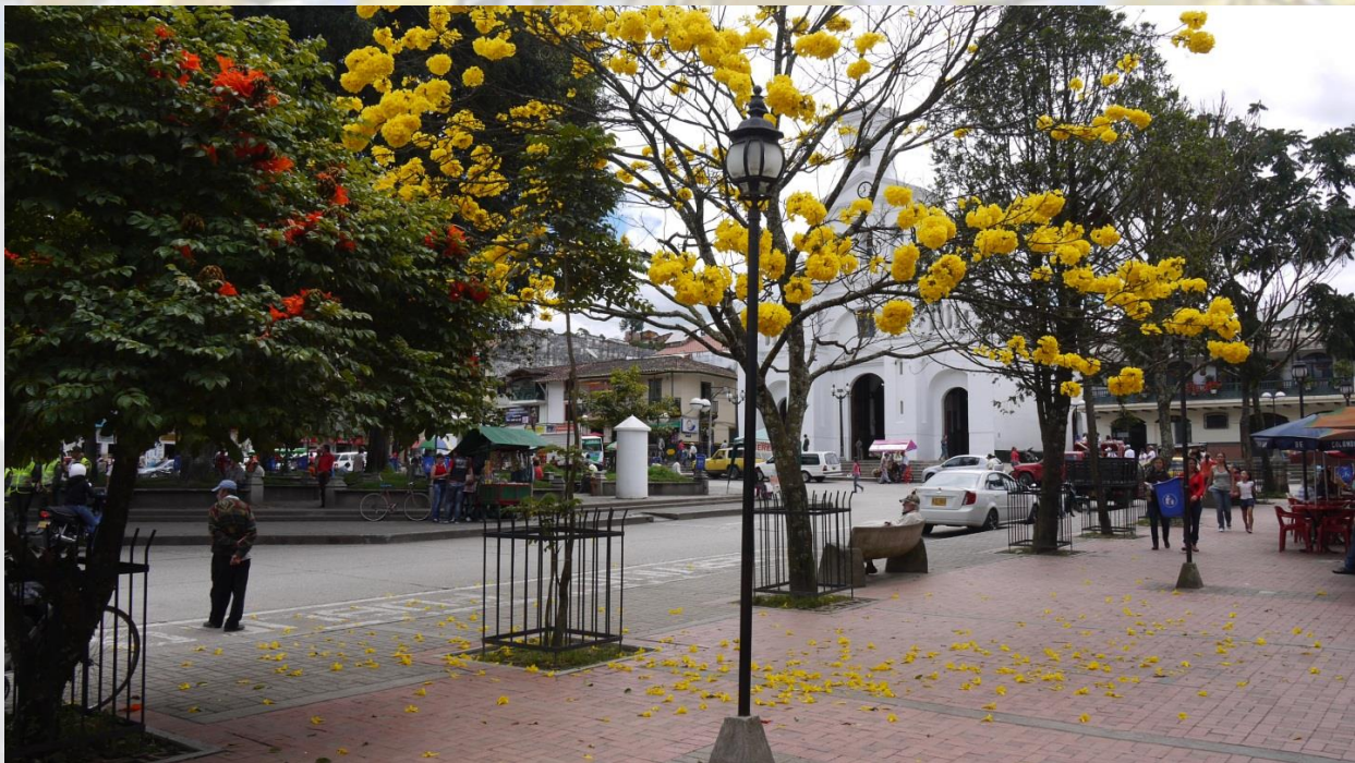
Parque Principal de Marinilla.

PLAN MUNICIPAL DE GESTIÓN DEL RIESGO DE DESASTRES