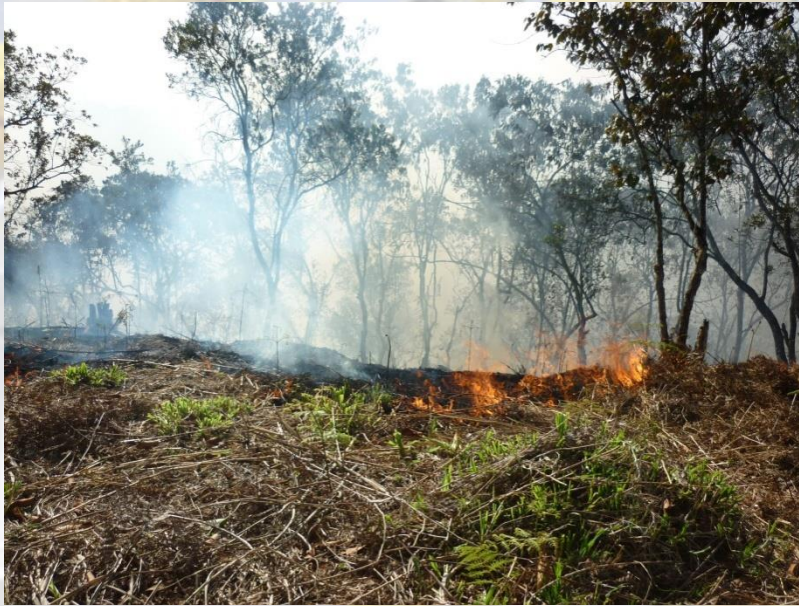
Incendio vereda Santa Cruz

extender desde su lugar de origen, su potencial para cambiar de dirección inesperadamente y su capacidad para superar obstáculos como carreteras, ríos y cortafuegos. En Marinilla son muy comunes las quemas en las veredas por parte de los campesinos, unas son de basuras e inservibles y otras son en los terrenos de siembra para poder hacer uso de estos, y en muchas ocasiones esas quemas se salen de control; otro caso se da con los veraneantes que no apagan bien sus fogones luego de un paseo o que arrojan latas y vidrios que hacen el efecto de lupa generando de esta manera también los incendios forestales. En este caso el impacto ambiental es muy fuerte ya que se afectan ecosistemas de la fauna silvestre, la pérdida y deterioro de suelos, la contaminación del aire, todas las partículas y productos del fuego que causan daños a las personas cercanas a estos incidentes, sin dejar de un lado el tema del Calentamiento Global, el efecto invernadero, daños que son irreparables y las décadas que tarda un bosque en recuperarse por completo.