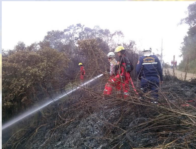
Incendio vereda Santa Cruz