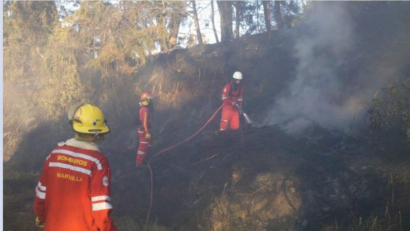
Incendio vía al peñol, vereda alto del mercado (sector tomate uno)