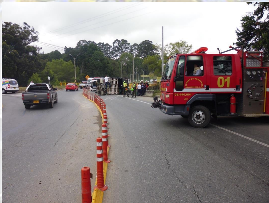
Volcamiento de vehículo autopista Medellín-Bogotá, retorno vestimundo