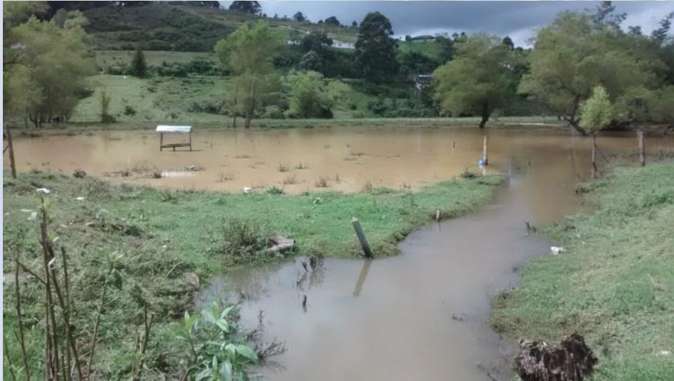
Inundación vereda El Recodo