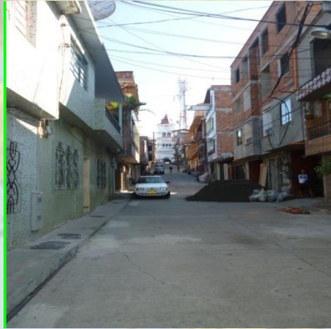
Materiales en la vía son arrastrados por el agua lluvia y taponan las obras transversales

Integrantes del CMGRD responsables de elaborar la respectiva caracterización (Formularios 1 a 5): Secretario de Planeación y demás miembros del comité de gestión del riesgo en el municipio.