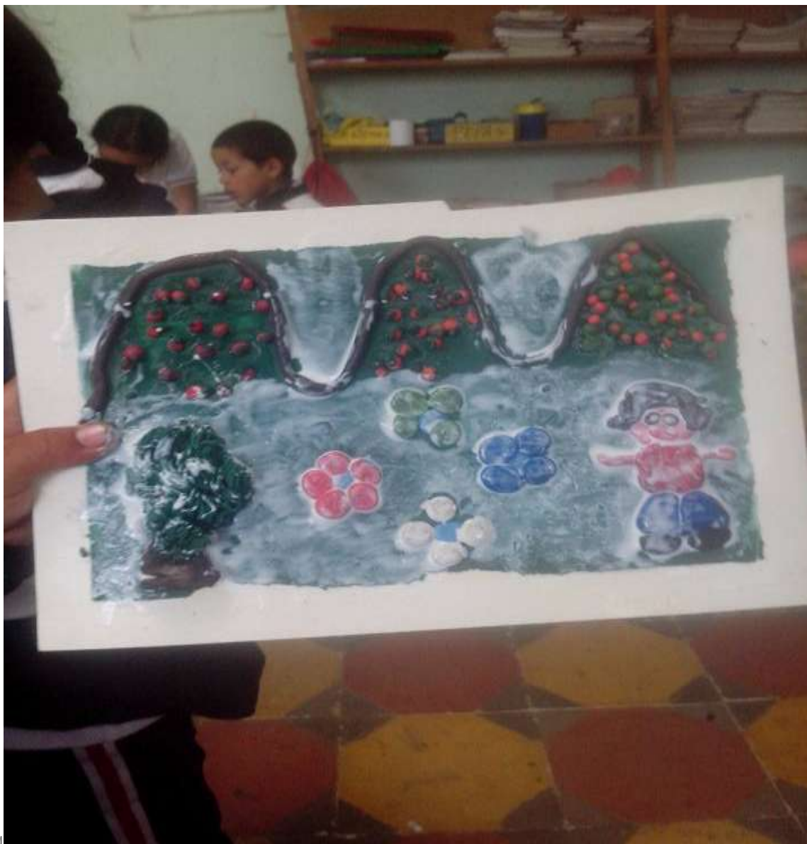
Imagen No 10.

pero mucho más dejar reflejado de manera artística su cotidianidad, y se pudo ver en los trabajos terminados.