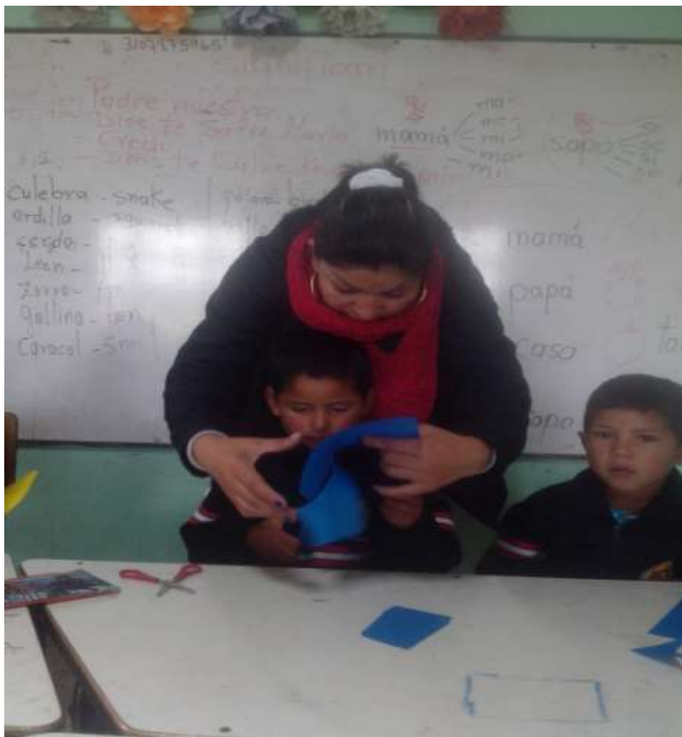
Imagen No 16.