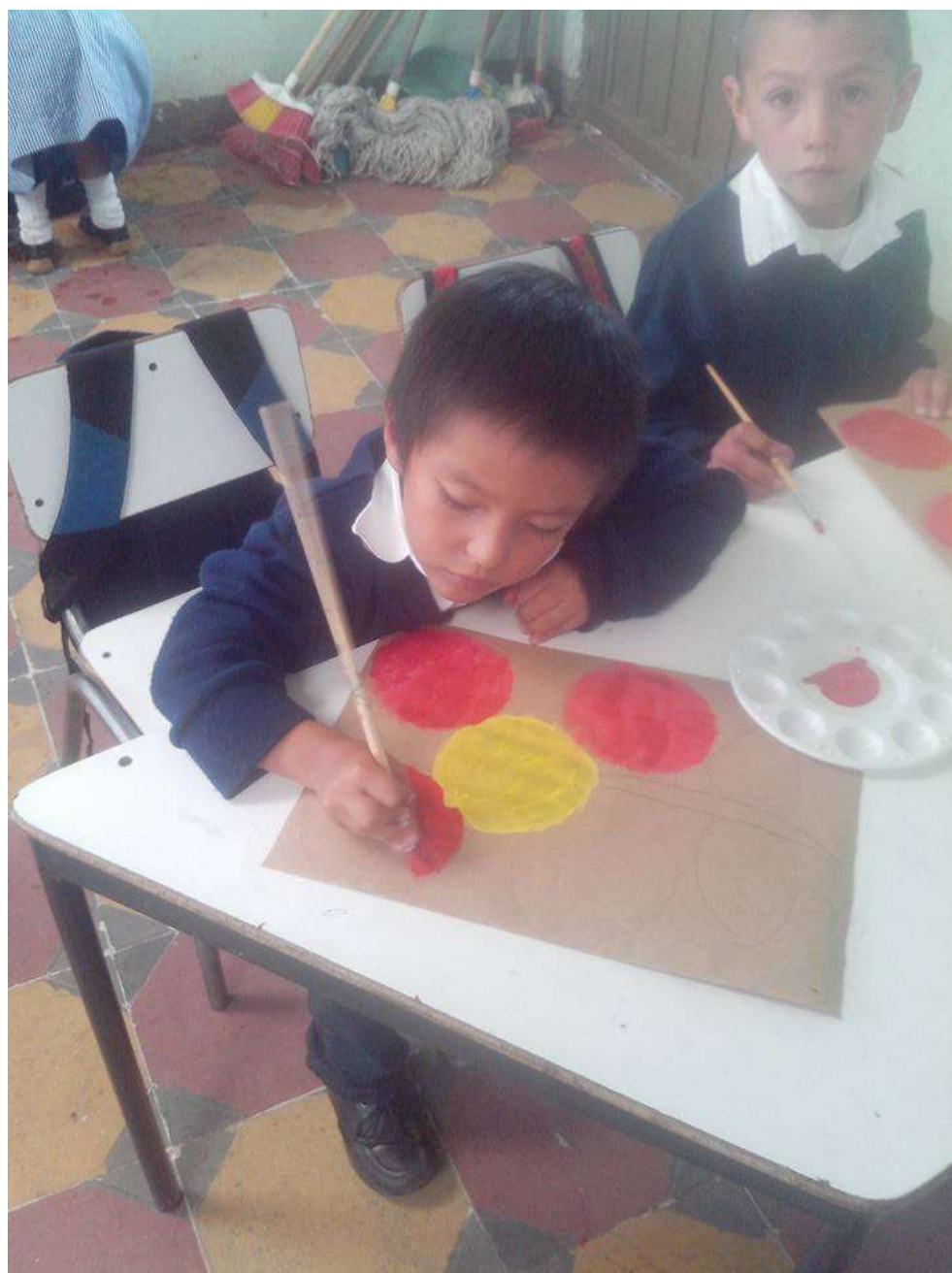
Imagen No 12. Fuente Investigadora