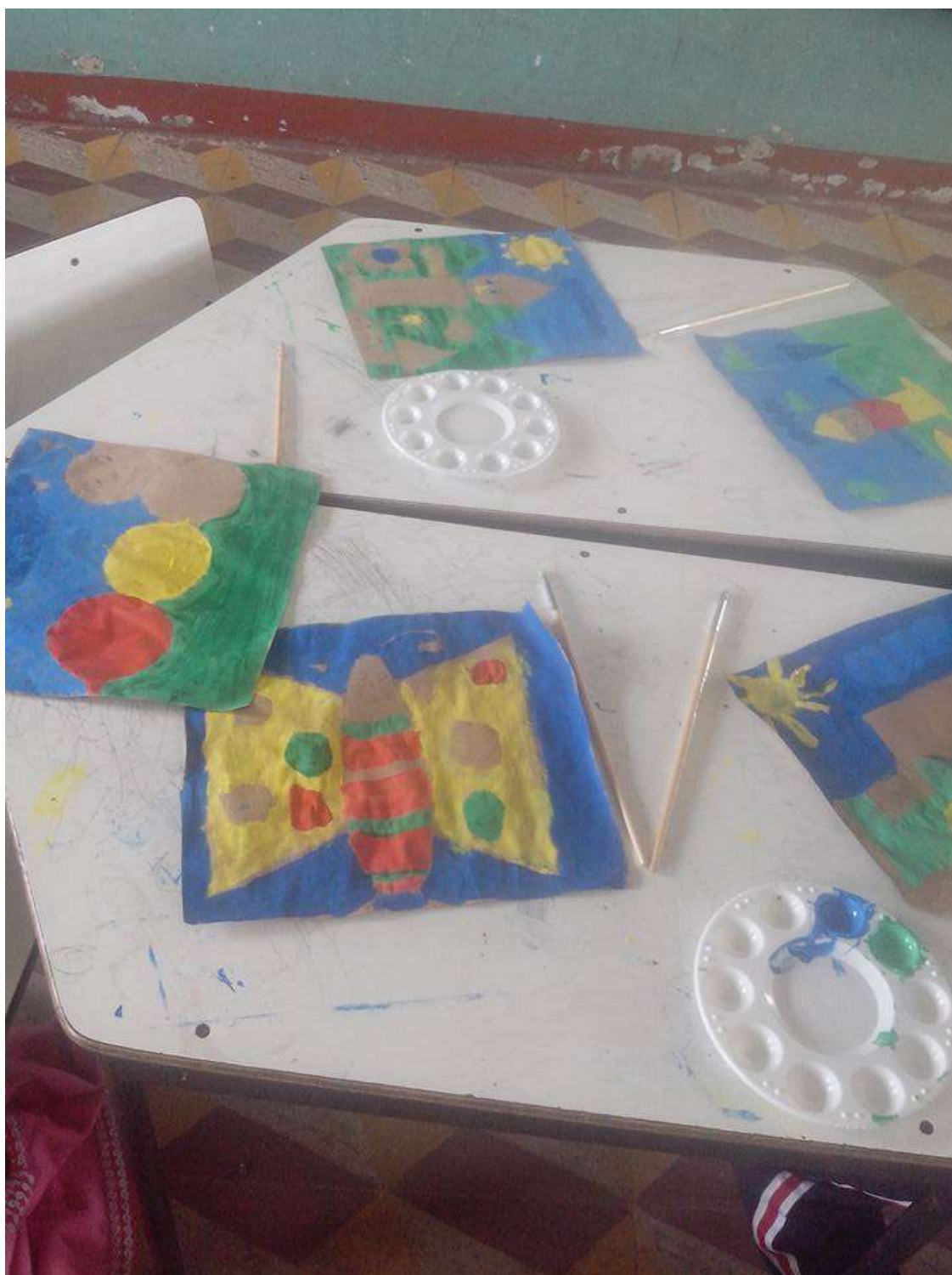
Imagen No 6.