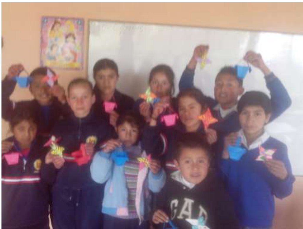
Imagen No 15.