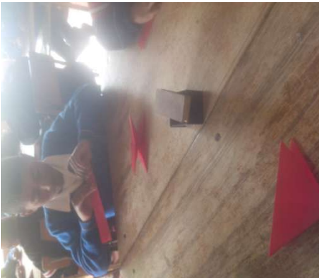
Imagen No 9.

Con esta actividad se buscó el desarrollo de la destreza viso-manual y la atención en los niños, ya que se comenzó con dobleces simples que requerían un mínimo de atención y seguimiento en cuanto a órdenes y pasos consecutivos que deberían seguir y ser precisos para así lograr la obtención de las figuras deseadas; la cuales eran simples en la técnica del origami. En el avanzar de la actividad se trabajaron figuras un poco más complejas que requerían mayor atención en dobleces maximizando su concentración en cuanto a escucha, seguimiento de órdenes y pasos para el logro de estas se están.