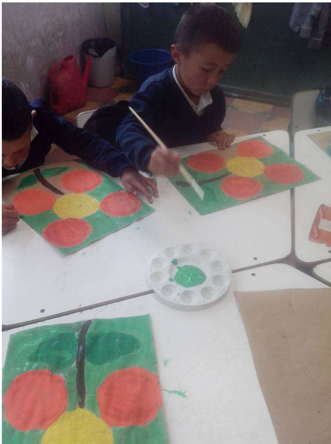
Imagen No 13.