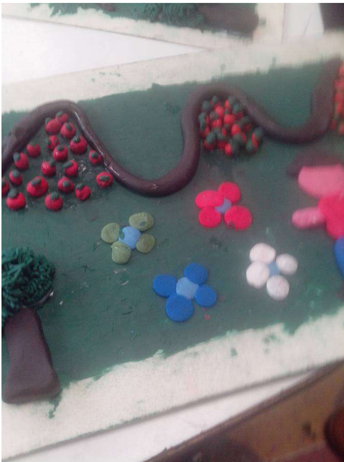
Imagen No 2.