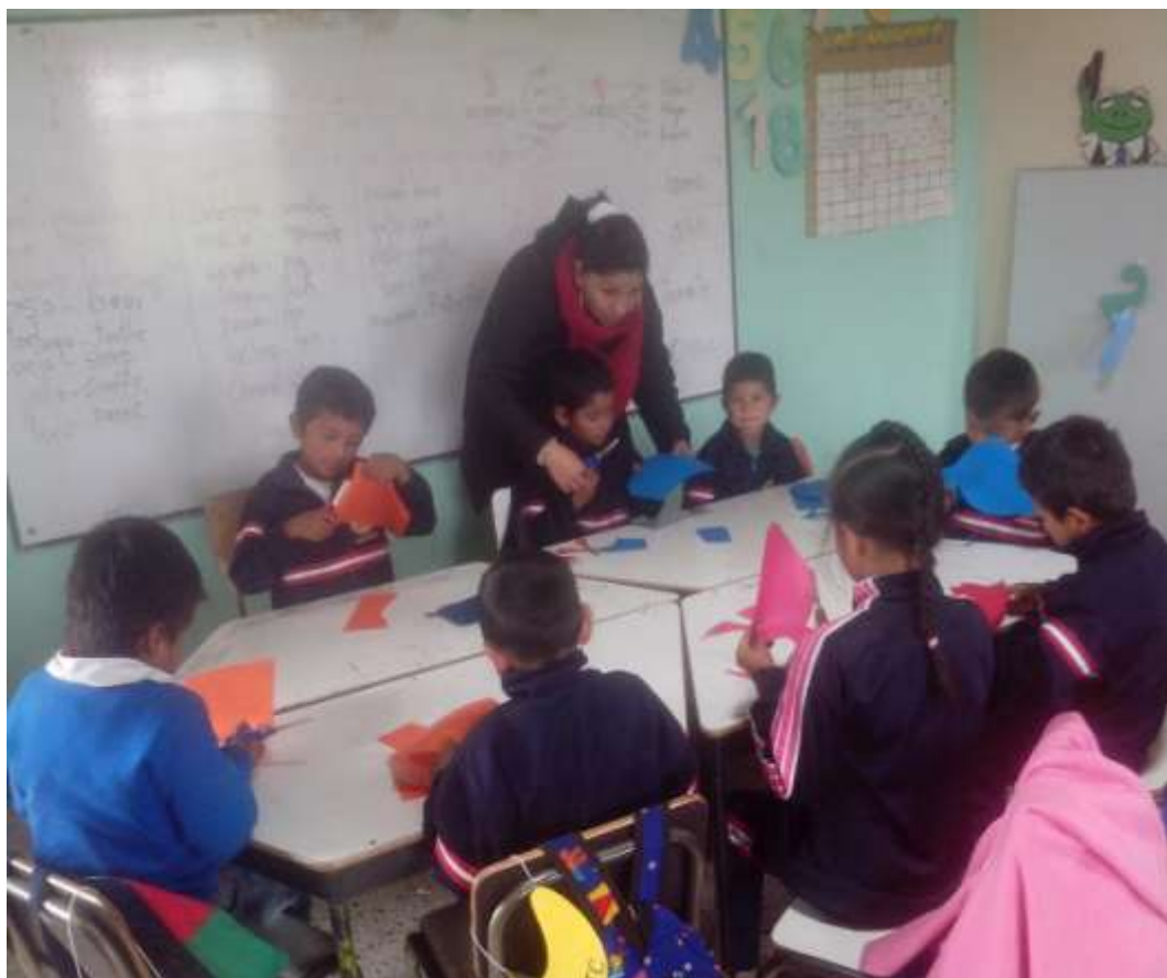
Imagen No 16.