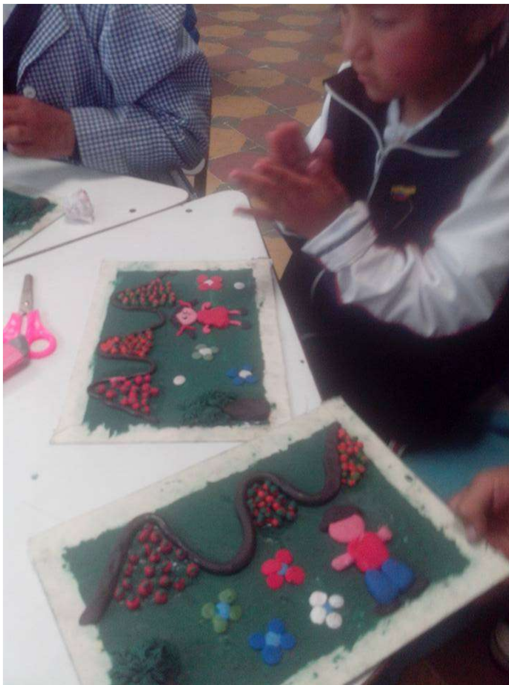
Imagen No 11. Fuente Investigadora