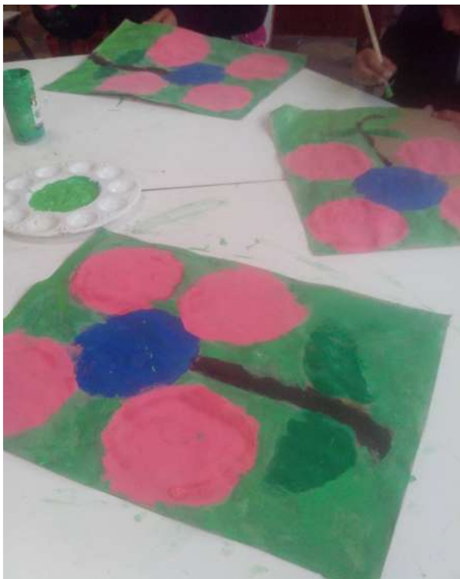
Imagen No 4.

dando y así obtener un aprendizaje verdadero duradero en este taller los niños escogieron dibujos de formas geométricas pero algo que ellos observan todos los días en su entorno la naturaleza, aplicando colores muy vivos pero a la vez realistas realizando cada uno de los pasos que se dieron en el taller y poniendo en práctica lo cognitivo, motriz, lo comunicativo y lo más importante su creatividad.