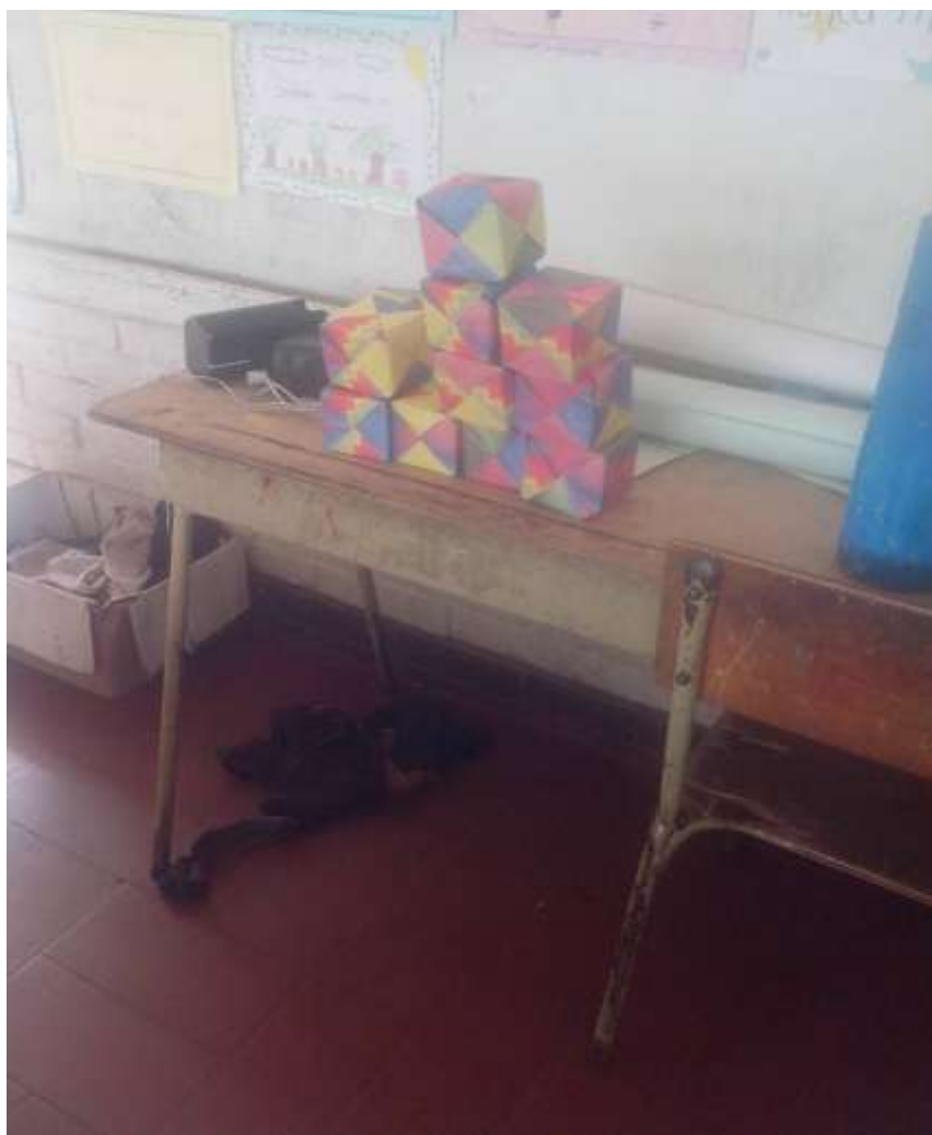
Imagen No 14.

Evaluación: cada niño la vea según su trabajo realizado en los tres tamaños y exponiendo cuales fueron sus dificultades al realizarlas.