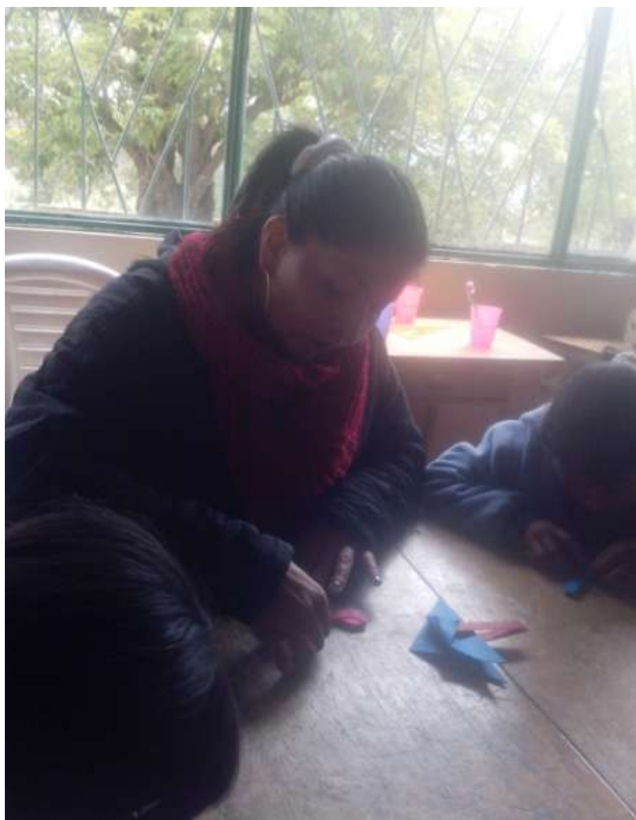
Imagen No 8.