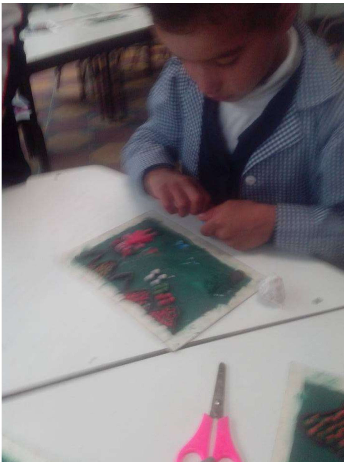
Imagen No 3.