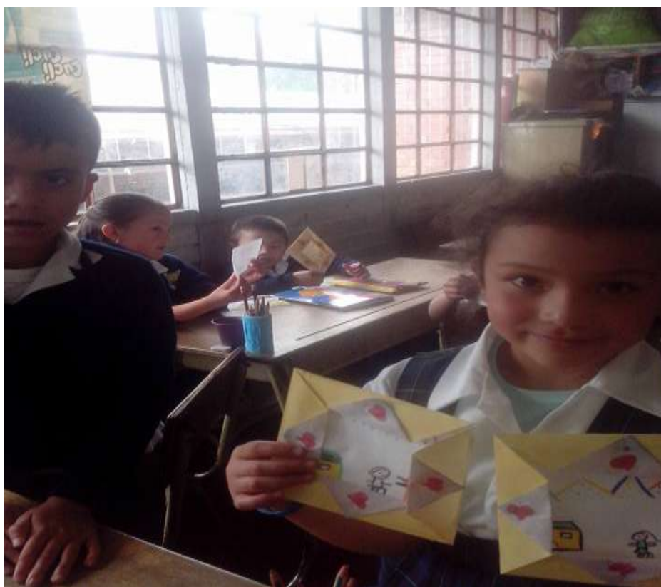
Imagen No 7.