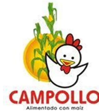
Figura 5. Logo Empresa Campollo