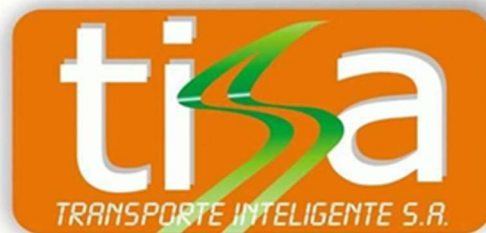
Figura 6. Tisa Transporte Inteligente S.A.