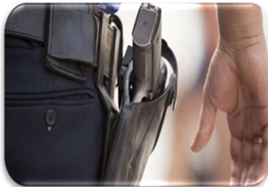
Figura 2. Imagen de la Empresa ASL