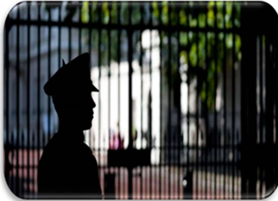
Figura 1. Imagen de la Empresa ASL

ASL Seguridad Ltda., tiene como objetivo principal, brindar un servicio de calidad enfocado en salvaguardar la seguridad del cliente y sus propiedades, así como la seguridad de nuestro personal en todo el territorio nacional, implementando altos estándares en los procesos y que aseguran la satisfacción de nuestros clientes.