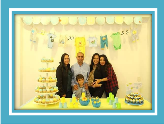
Foto 4. Núcleo Familiar.

A nivel social en la familia soy la segunda hija y me destaque por la dedicación al estudio y me destaque por ser la conciliadora para resolver los problemas entre los hermanos.