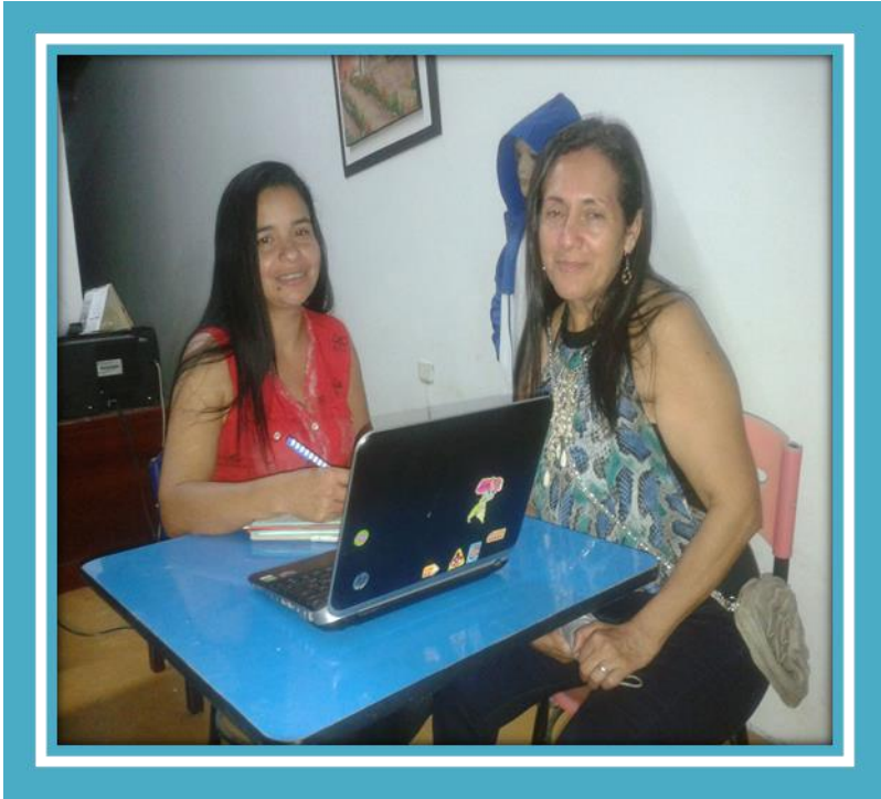
Foto 2. Entrevistando a la Profesora.