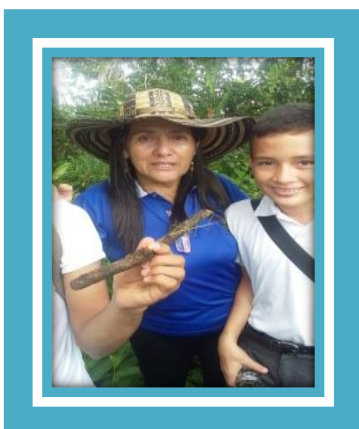
Foto 7. Prácticas Pedagógicas

mega diversa teniendo en cuenta su importancia para la súper vivencia del hombre. Con frecuencia utilizo la ecología recreativa, las salidas de campo, experimentación, elaboración de modelos, esquemas, mapas y tramas conceptuales para indagar, identificar, explicar los fenómenos naturales.