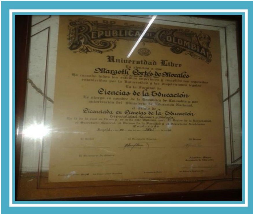
Foto 8. Formación Docente.