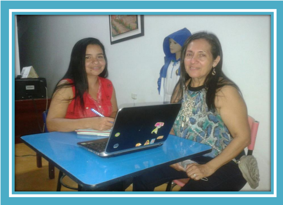
Foto 10. Fin de la Entrevista.