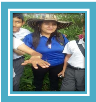
Foto 6. Explorando el conocimiento.

3. Cuáles son los saberes pedagógicos que usted resalta en su labor docente?