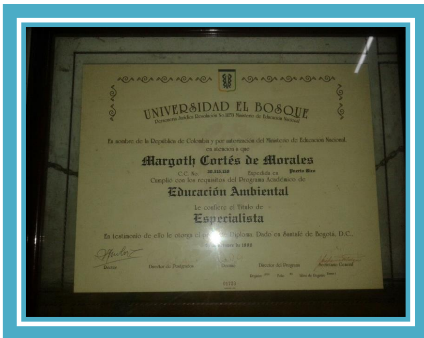
Foto 8. Formación Docente.

propuestas de manera conjunta buscando apoyo, asesoría, recursos y orientación para que exista armonía en el trabajo de grupo a pesar de las dificultades.