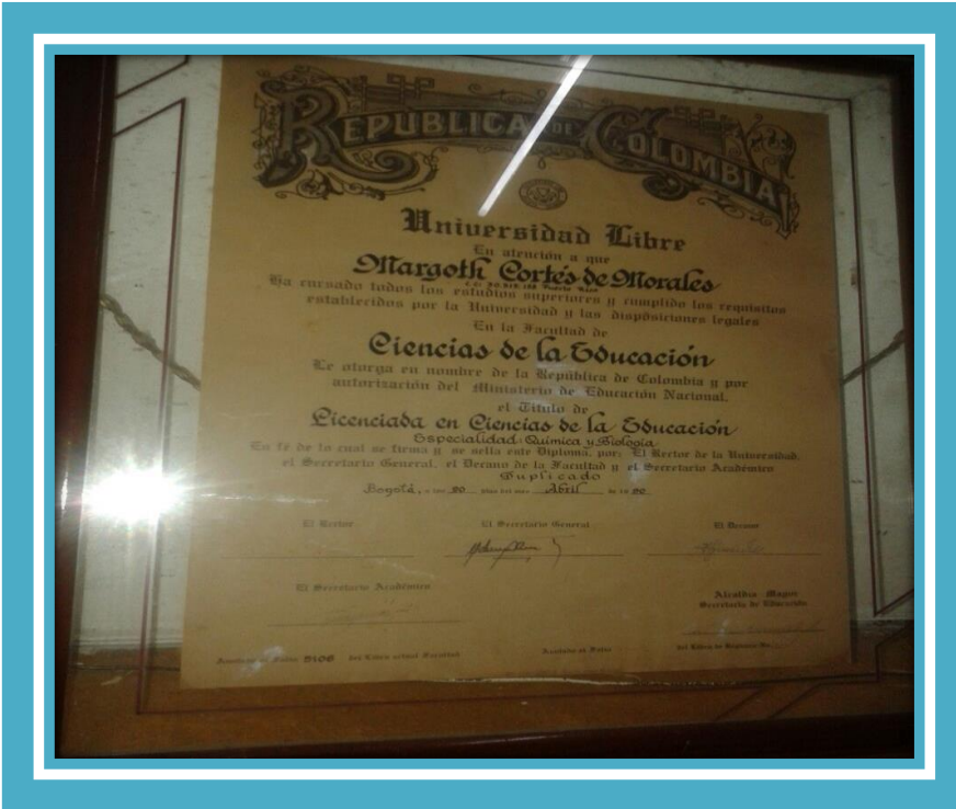
Foto 9. Formación Docente.