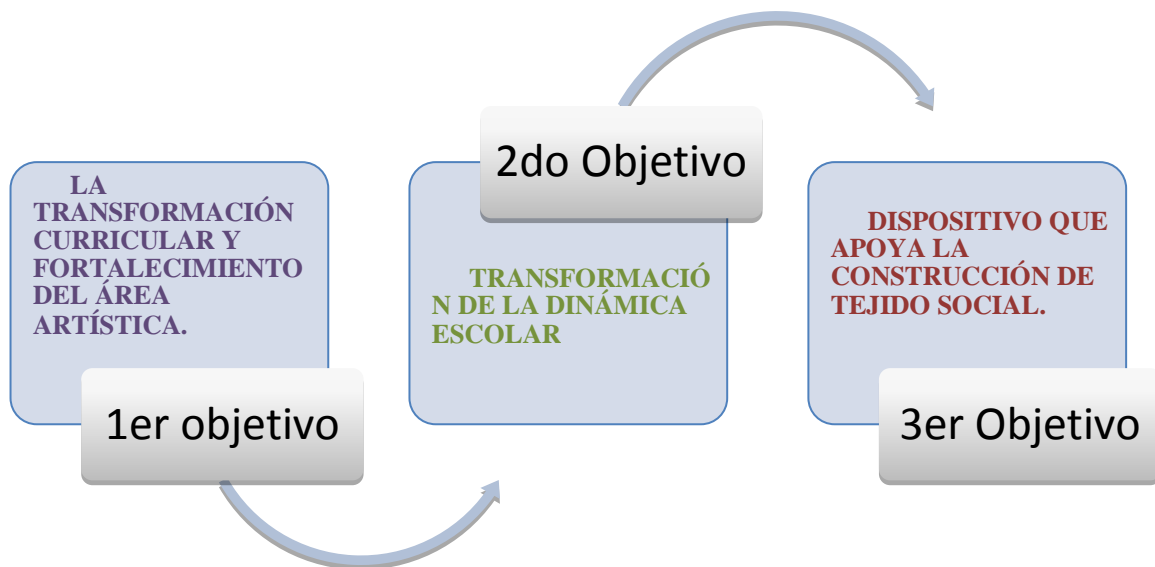
Figura 2. Categorías Emergentes.