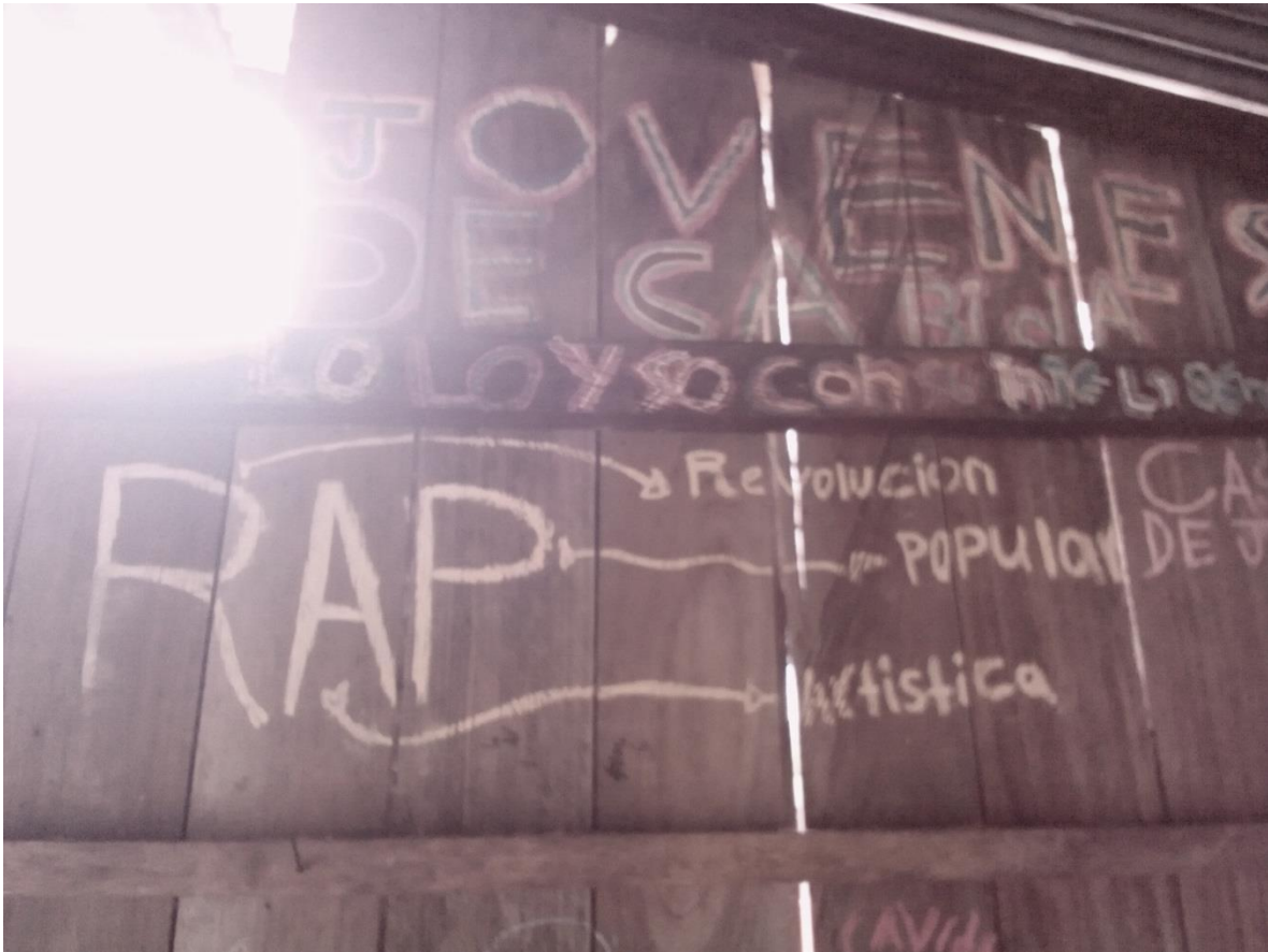
2014. Casa de los jóvenes. Cacarica