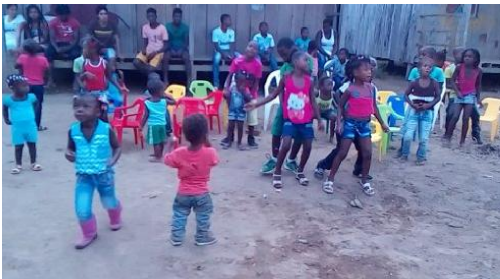
Imagen 4 Fiesta de niños Cacarica

2014, Zona Humanitaria Nueva Esperanza en Dios.