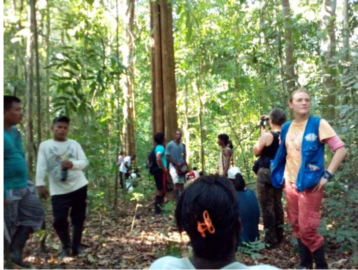
2014, Cerro Mocho. Imagen 7 Misión verificación en el territorio