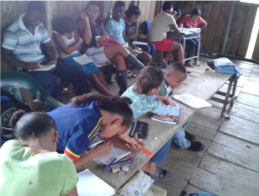
Imagen 9 Colegio “Construyendo el futuro desde la resistencia”

2014. Curvaradó.