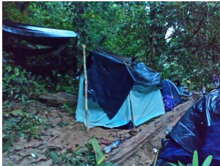
2014, Cerro Mocho. Campamento verificación

Las amenazas y retenes por parte de grupos paramilitares no cesan: testigos que participaron en el juicio ante la Corte Interamericana de Derechos Humanos no han podido regresar a sus territorios por falta de garantías, las organizaciones