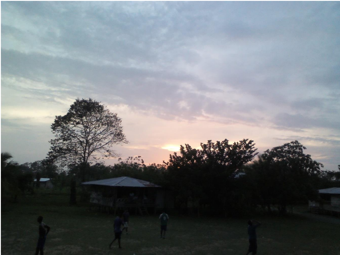
Imagen 3 Zona Humanitaria Camelias es Tesoro

Curvaradó, 2014.