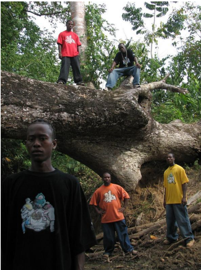
Imagen 5 Renacientes en su territorio