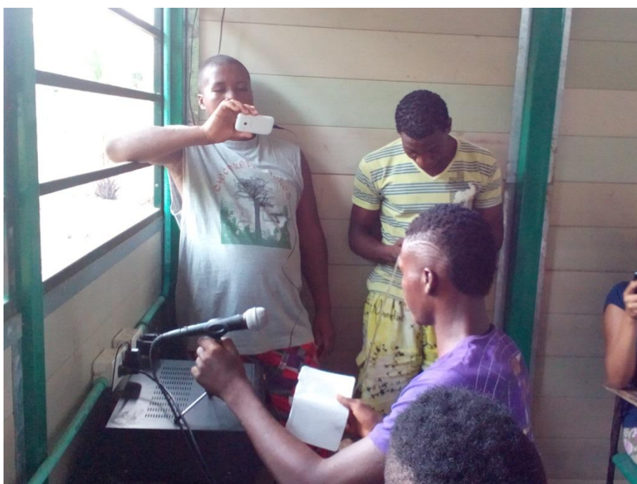
Imagen 8 Emisora comunitaria de la Zona Humanitaria Nueva Esperanza en Dios

Este año fueron condenados 16 empresarios palmeros de la región del Urabá, por los delitos de “concierto para delinquir agravado, desplazamiento forzado e invasión de área de especial importancia ecológica” (Contagio radio, 2015