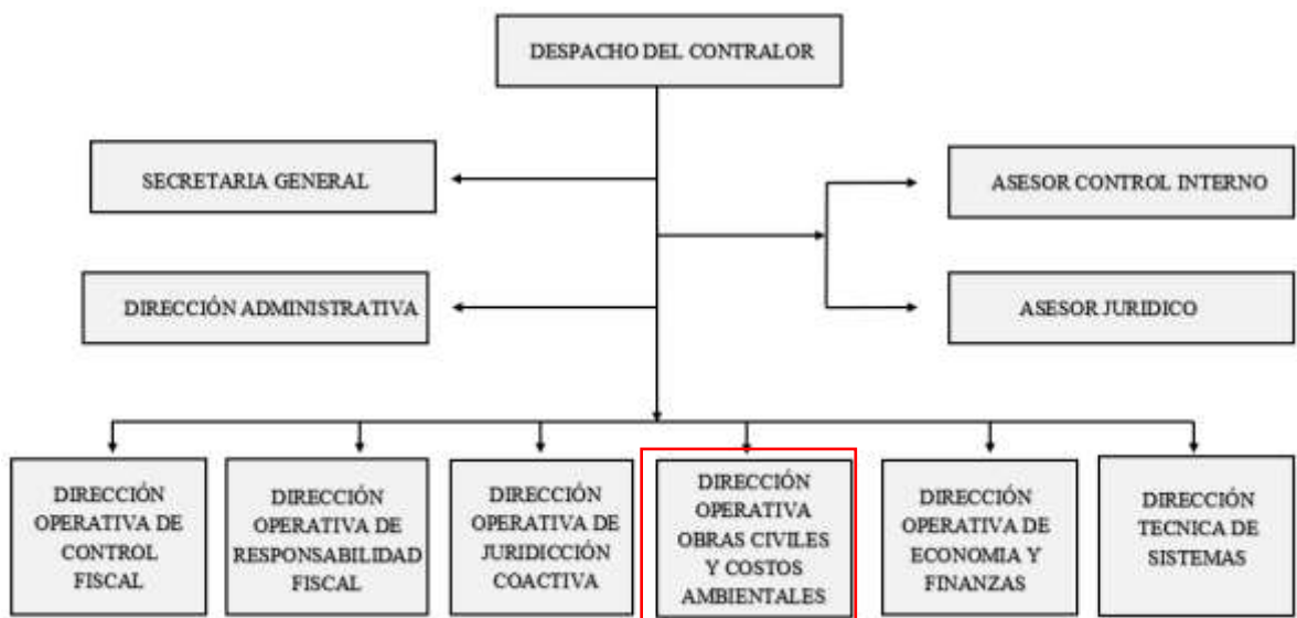
Figura 3 Estructura Organizativa de la Contraloría. (Contraloria,2022)

La Contraloría está dividida (figura 3) por dependencias para brindar una mejor organización y dar así una buena inspección de los recursos y patrimonios del departamento: