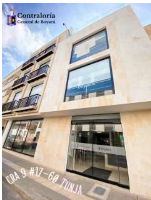
Figura 2 Localización de la Contraloría, (Contraloría General De Boyacá, 2023)

Por medio de la ordenanza N.º 18 del 28 de abril de 1926, se creó el Departamento de la Contraloría, la cual destino funciones al entonces vigente Tribunal de Cuentas. Actualmente, está ubicada (figura 2) en la carrera 9ª. N.º 17-60, donde ejerce sus funciones en el tercero y cuarto piso, pues allí el contralor vela por los recursos públicos del departamento de Boyacá, interviniendo en posibles irregularidades o fraudes, efectuando sanciones a los trabajos si lo considera pertinente. (Contraloría General De Boyacá, 2023)