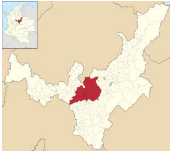
Figura 1 Departamento de Boyacá (Gobernación de Boyacá, 2023)

Tunja es un municipio que está situado en la Provincia centro, con una extensión de 121.49 Km^2 , cuenta con 180.568 habitantes aproximadamente, temperatura media de 13 °C y limita por el norte con Motavita y Cómbita, al oriente, con Oicatá, Chivatá, Soracá y Boyacá, por el sur con Ventaquemada y por el occidente con Samacá, Cucaita y Sora. (Alcaldía Mayor de Tunja, 2023)