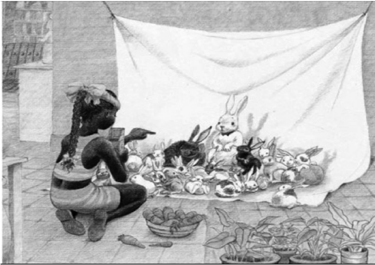
Imagen 2. Niña bonita. Por Ana María Machado (1996).