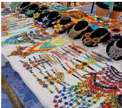
Figura 8. Mercado de artesanías

La visita al Mercado de Artesanías de El Salvador fue una inmersión en la cultura local, donde los artesanos venden productos hechos a mano como textiles, cerámica y madera tallada. Al recorrer los coloridos puestos, tuvimos la oportunidad de conocer el proceso detrás de cada pieza y conversar con los creadores, quienes compartieron su pasión por el arte y las tradiciones. Este mercado no solo es un centro comercial, sino también un espacio clave para la economía local, ya que muchos dependen de estas ventas para su sustento, al mismo tiempo que preservan las costumbres y técnicas artesanales que han pasado de generación en generación.