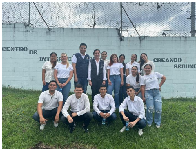
Figura 5. Visita el centro de reclusión de menores el Espinel.

Más tarde, nos dirigimos al Centro de Integración Social del Espino , una institución dedicada a la inclusión y el desarrollo de comunidades vulnerables. En este lugar, tuvimos la oportunidad de interactuar con los trabajadores y los beneficiarios del centro, quienes nos compartieron sus experiencias y logros. El centro ofrece programas educativos y de apoyo social, lo que contribuye al bienestar e integración de personas que enfrentan diversas dificultades. La visita nos permitió conocer una faceta más humana de El Salvador, donde la comunidad se esfuerza por mejorar las condiciones de vida a través de la educación y el trabajo conjunto. Ambos lugares, aunque diferentes en su naturaleza, reflejan el compromiso del país con su historia y su presente, y nos ofrecieron una perspectiva única de la riqueza cultural y social de la región.