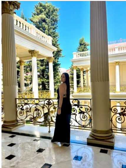
Figura 6. Visita al Palacio Nacional

Después, nos dirigimos al Parque Ilopango , un lugar natural que ofreció un contraste perfecto con la experiencia urbana del Palacio Nacional. El parque, ubicado alrededor de la impresionante laguna de Ilopango, es un destino popular tanto para los locales como para los turistas. Disfrutamos de un paisaje relajante, con aguas cristalinas y una vegetación exuberante que invita a la reflexión y el disfrute del aire libre. Pudimos ver cómo el volcán Ilopango, cuyo cráter alberga la laguna, domina el horizonte, recordándonos la poderosa geografía que define al país. Pasamos una tarde tranquila, compartiendo con los compañeros y observando la belleza de este entorno natural que ofrece una pausa perfecta en medio de la vibrante vida de la ciudad.