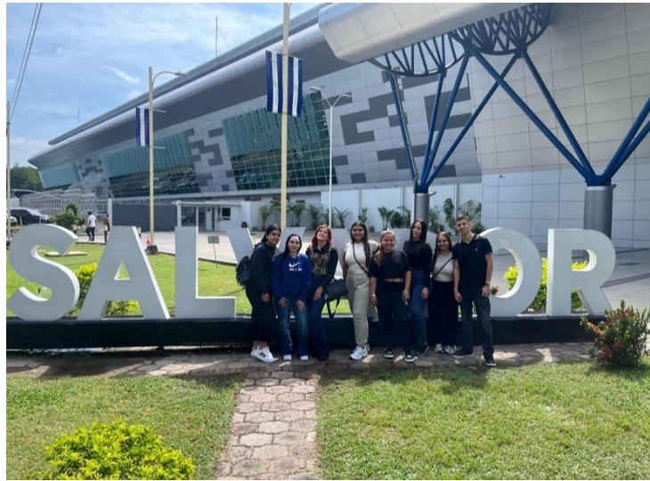
Figura 1. Aeropuerto de San Salvador

Día 2/ 19 de Octubre, Parque Natural Puerta del Diablo y gastronomía local.