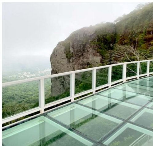
Figura 2. Parque Nacional Puerta del Diablo.

Nuestro día inició con la visita al parque de la puerta del Diablo ubicado en Panchimalco, el cual se caracteriza por sus paisajes y el ser un lugar turístico, donde se logra observar el pequeño pueblo de panchimalco. Este día se logró probar su gastronomía, probando las Pupusas, es una comida tradicional de El Salvador, similar a la arepa rellena colombo-venezolana. Para terminar el día asistimos al teatro Nacional en el centro histórico donde logramos observar al presidente Nayib Bukele (Presidente de El Salvador) que ha sido una de las personas más sobresalientes en América.