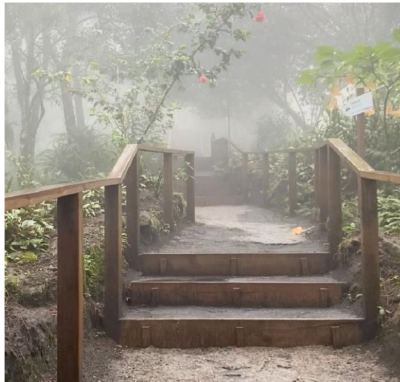
Figura 3. Parque Nacional del Boquerón.

Para terminar nuestro día asistimos en la tarde a una piscina termal, la cual tiene beneficios medicinales donde logramos compartir con nuestros compañeros, además de identificar características del lugar como es la protección a estos espacios por parte de la población salvadoreña.