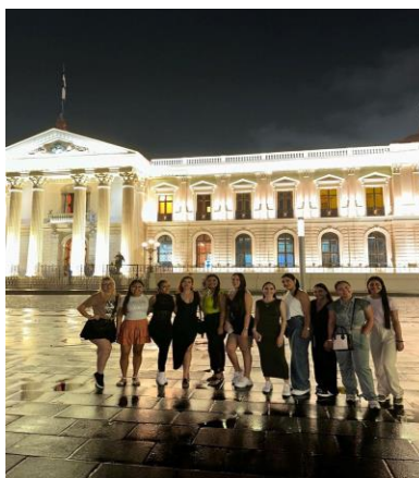
Figura 4. Centro Histórico de San Salvador.

En términos de seguridad, el Centro Histórico de San Salvador muestra un notable esfuerzo por mantener un entorno protegido y accesible para los turistas. Durante nuestra visita, nos sentimos seguros en todo momento, gracias a la presencia de autoridades locales y a la organización de los espacios públicos, que invitan a los visitantes a disfrutar de la ciudad con tranquilidad. La combinación de la belleza arquitectónica, la historia y la seguridad en este área nos permitió explorar con mayor libertad y apreciar las joyas culturales de la capital salvadoreña.