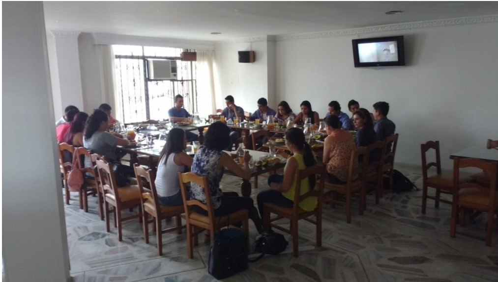
Figura 14. Almuerzo especial en el sur de la ciudad de Cali, Por Rubén Darío Piñeros Muñoz, 2018

Hacia de la tarde se reunió a todo el grupo para un almuerzo especial en el sur de la ciudad de Cali.