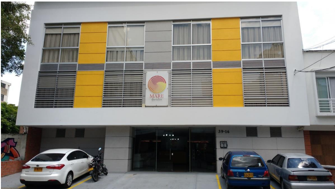
Figura 6. Hotel Mare Aparta Suite en Cali, Por Rubén Darío Piñeros Muñoz, 2018

El arribó a la ciudad de Cali fue el 8 de octubre a las 11 de la mañana, se tomó un receso de una hora mientras se acomodaban en las habitaciones del hotel Mare Aparta Suite.