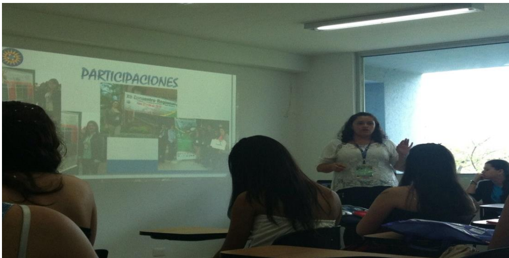
Figura 9. Exposición segundo grupo facultad de contaduría Pública.