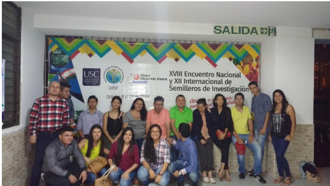
Figura 18. Grupo de estudiantes que asistieron al evento, por Rubén Darío Piñeros Muñoz, 2018