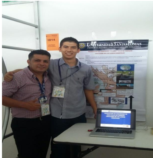
Figura 11. Exposición primer grupo de administración de empresas agropecuarias, Por Rubén Darío Piñeros Muñoz,2018

Uso de Facebook por parte del sector turístico en la ciudad de Villavicencio, como herramienta de la mezcla de comunicación por Alex Samir Moisés Facultad de Administración de Empresas Agropecuarias.