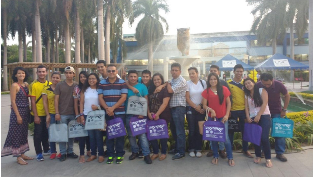
Figura 7. Participantes al evento, Por Rubén Darío Piñeros Muñoz, 2018

3 horas, luego se tomó la cena en la universidad y se observó una par de actividades que se estaban realizando en el Ágora de la universidad, finalmente sobre las 7 y 30 de la noche.