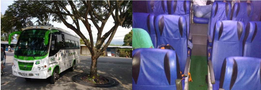
Figura 5. Viaje asistencia