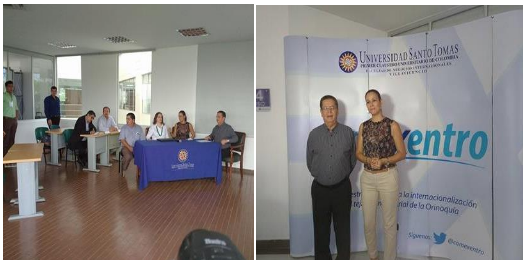
Figura 19. Evento Llamado Denominación de Origen