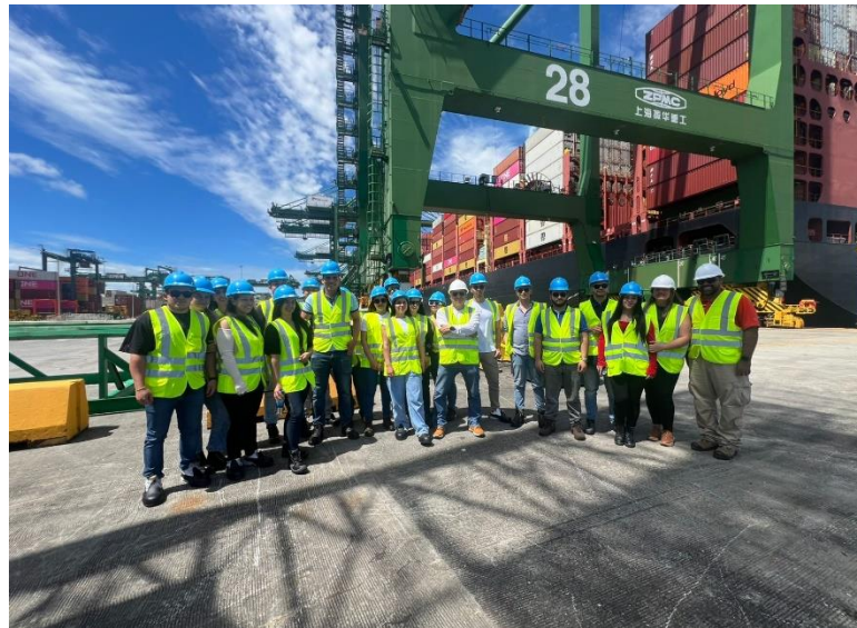
Figura 4 Visita a Terminal Portuario PSA de Panamá