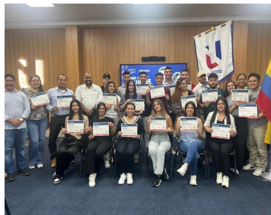
Figura 5 Universidad de Istmo, último seminario y entrega de certificación Diplomado

Sin duda alguna una de las mejores visitas fue al puerto PSA panameño donde se identificaron todas las operaciones en vivo y en directo con el tráfico de contenedores, logística, carga, grúas porticas, etc. Tal como lo muestra la figura 4.