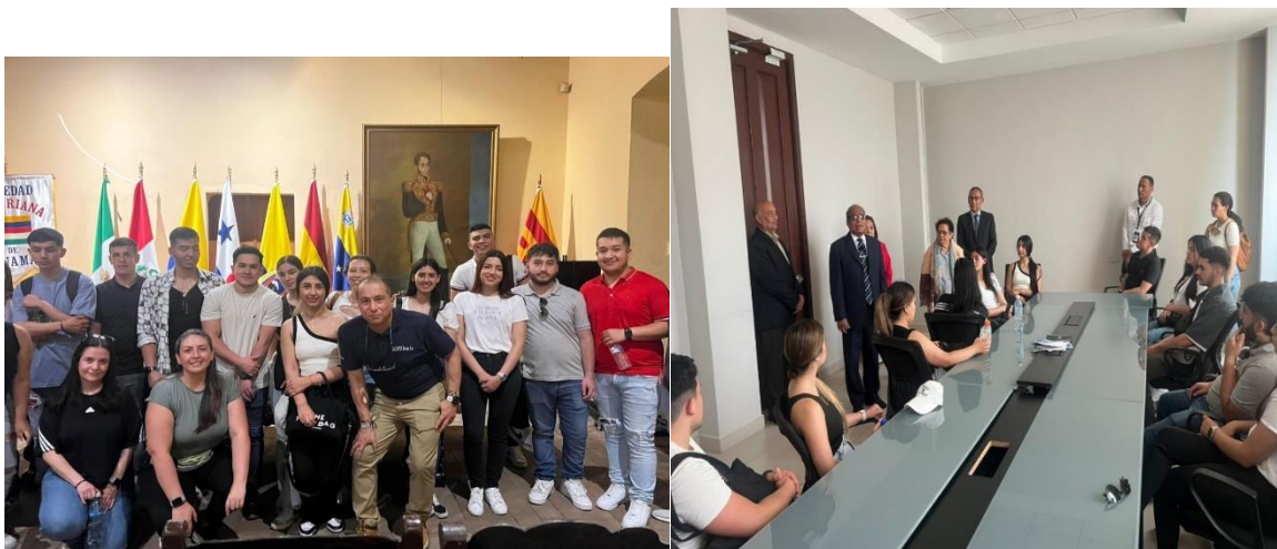
Figura 3 Visita al Ministerio de Relaciones Exteriores de Panamá

De antemano, ilustrar algunas imágenes como evidencia que se realizó la misión académica a Panamá (2024), con visitas a instituciones de gran importancia, como lo son, al Ministerio de Relaciones Exteriores, visita a Cámara de Comercio, Industrias y Agricultura de Panamá, así como a centros educativos de formación como INADEH y a grandes puertos y zonas francas.