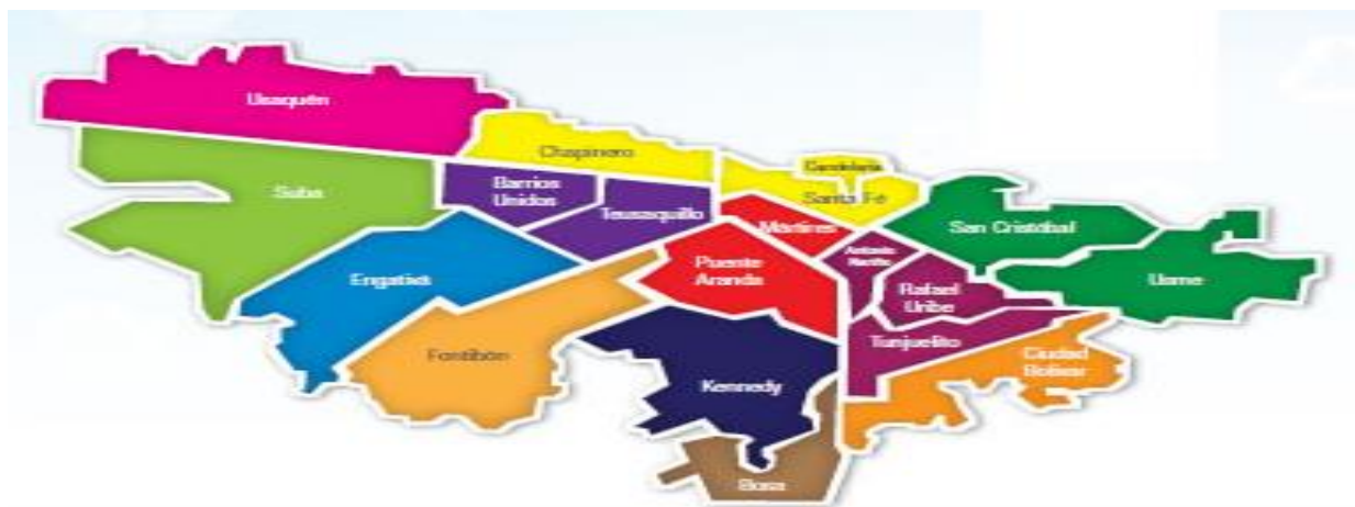
Figura 1. Mapa de las localidades de Bogotá. Esta figura nos permite observar la ubicación de la localidad de Ciudad Bolívar en comparación con las demás localidades de la ciudad de Bogotá. En donde se aprecia su ubicación geográfica en los linderos de la periferia, por lo que se entiende su importante extensión rural como característica territorial.

de Usme. Ocupando el segundo lugar en extensión rural entre las demás localidades de la ciudad.