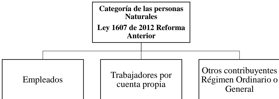
Figura 1 Mapa Conceptual Ley 1607 de 2012.

La ley 1607 de 2012 dispuso la categorización de las personas naturales que se muestra en la siguiente estructura: