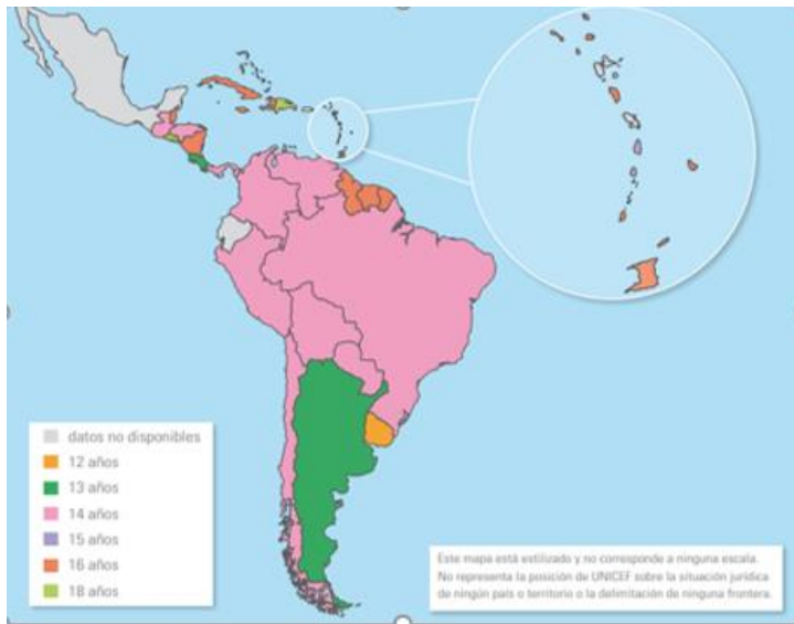
Ilustración 1. Edad mínima de consentimiento sexual en el caso de América Latina

Fuente: Unicef. (2016). Revisión de la situación en América Latina y el Caribe respecto a las edades mínimas legales y la realización de los derechos de los y las adolescentes