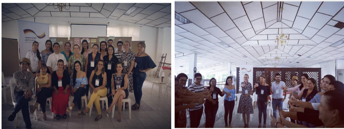
Fotografía 1 Reunión mesa técnica de turismo. Autoría Propia – Agosto 2017

De esta reunión tuve que realizar la relatoría y enviarla a todos los integrantes que asistieron a la reunión.