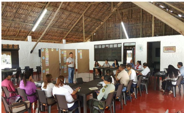
Fotografía 2 relatoría asistentes a la reunión. 31 de Mayo del 2017

Al igual que la anterior reunión tuvo que elaborar relatoría y enviar a todos los asistentes a la reunión.