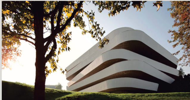
Escuela internacional de cocina Fernando Pérez

Ubicación: Valladolid, España. Estilo arquitectónico: Funcionalista