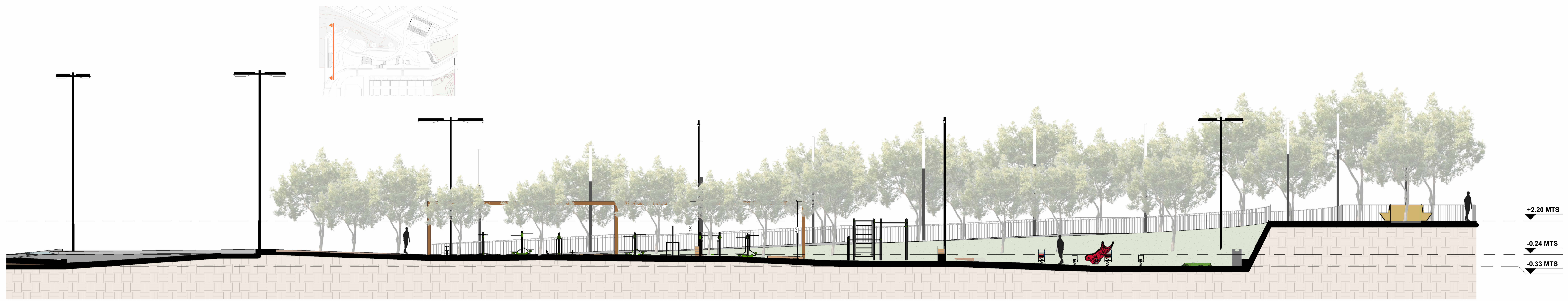
CORTE A-A' ESC. 1.100