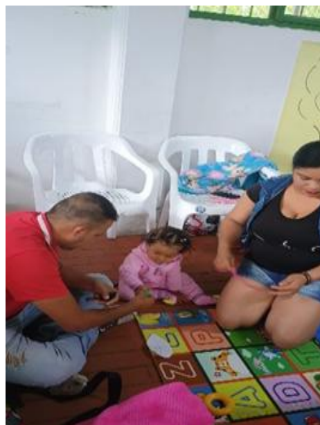
Figura 11 Estimulación del lenguaje Por medio de onomatopeyas.

https://www.blaclinic.com/juegos-para-estimular-el-lenguaje-desarrollo-del-tus-hijos/#:~:text=Juega%20a%20esconderte%20por%20alg%C3%BAn%20sitio