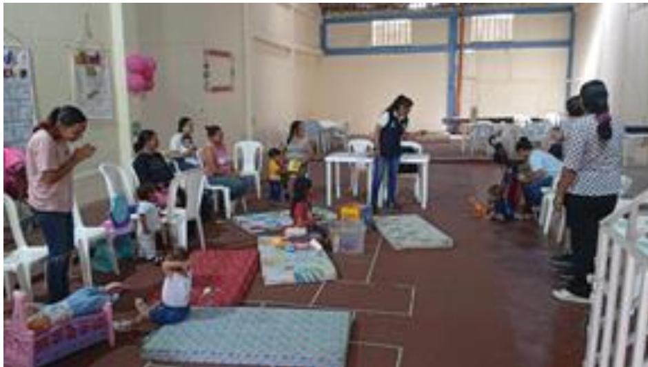
Figura 3 EEG. Valderrama, z. (2025) promoviendo la inclusión a través del sonido [fotografía].

Figura 2 EEG. Valderrama, Z. (2025) trabajando buscando el sonido con ambientes enriquecidos [fotografía].