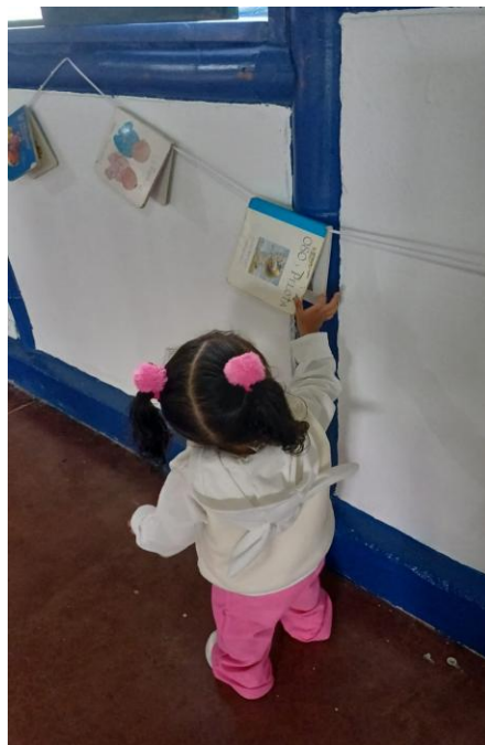
Figura 10 EEG. Valencia, L. (2025) escuchando historias al oído [fotografía].