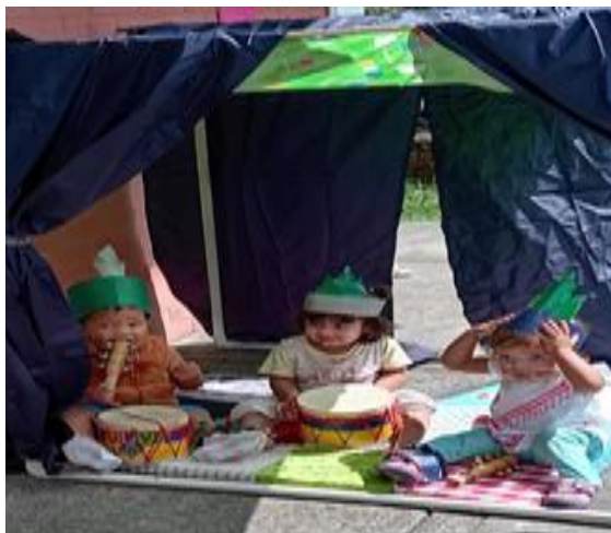
Figura 4 EEG. Valderrama, Z. (2025) estimulando el lenguaje con el juego del sapito [fotografía].