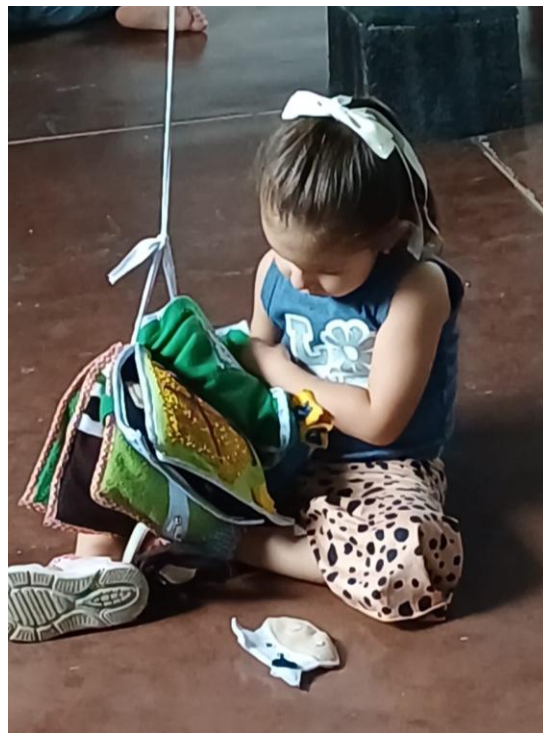
Figura 9 EEG. Valencia, L. (2025) creando historias en conos de papel higiénico [fotografía].