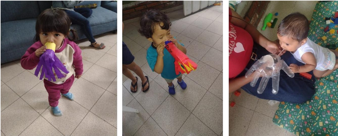
Figura 1 Estimulación del lenguaje Monstruo de la alegría.

Por medio de estas actividades se pudo evidenciar que estas deben ser repetitivas. Además, con el apoyo de la madre y acudientes, los niños se animaron a repetir los ejercicios, observando que les era más agradable vocalizar. Al finalizar el ejercicio, ellos solo querían continuar repitiendo palabras e iban imitando con más facilidad cada palabra en su vocabulario.