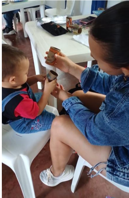
Figura 8 EEG. Valencia, L. (2025) explorando libros de texturas que cuelgan del techo [fotografía].