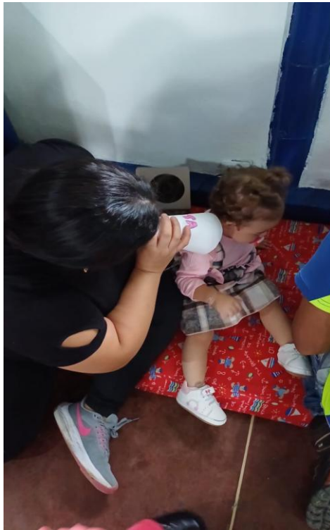
Figura 7 EEG. Valencia, L. (2025) creando historias en conos de papel higiénico [fotografía].