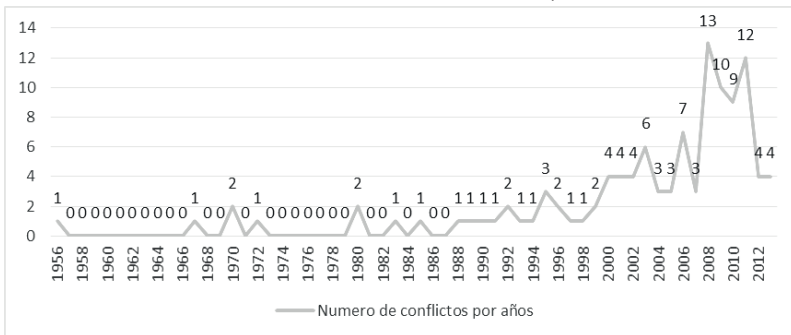
Gráfico 1. Generación de conflictos por año