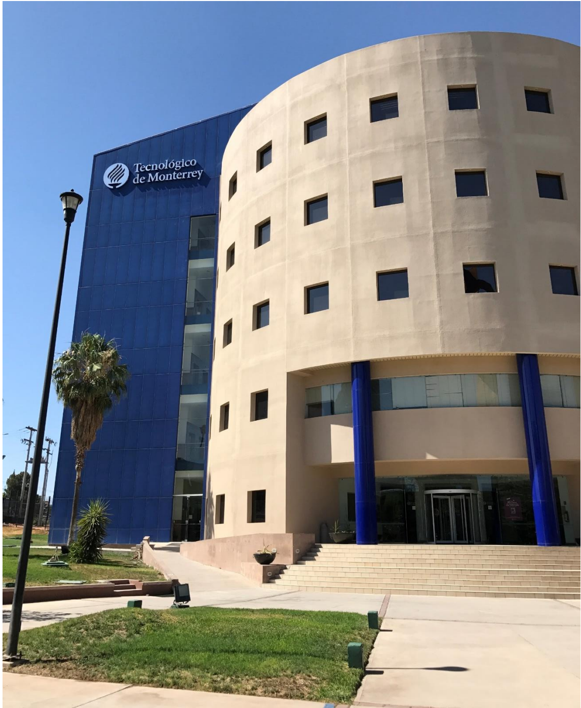
Fotografía 1. Instituto Tecnológico y de Estudios Superiores de Monterrey, Campus Chihuahua.