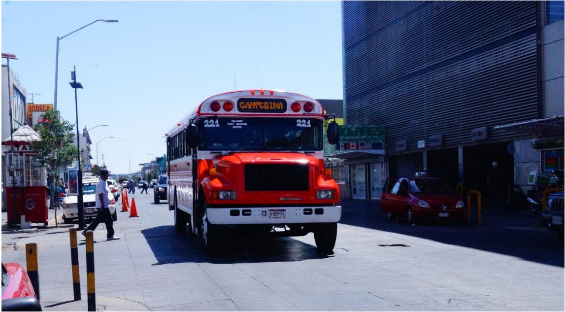
Fotografía 7. Panorama estado de los autobuses convencionales para las rutas alimentadoras.