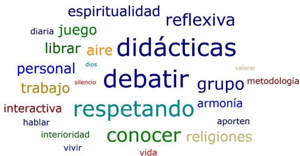
Gráfico 06: nube de palabras, categoría 03

Finalmente, se presenta la posición que mantienen los estudiantes en las entrevistas semiestructuradas aplicadas a ellos, donde con la última pregunta 03 ¿cómo sueña vivir una clase