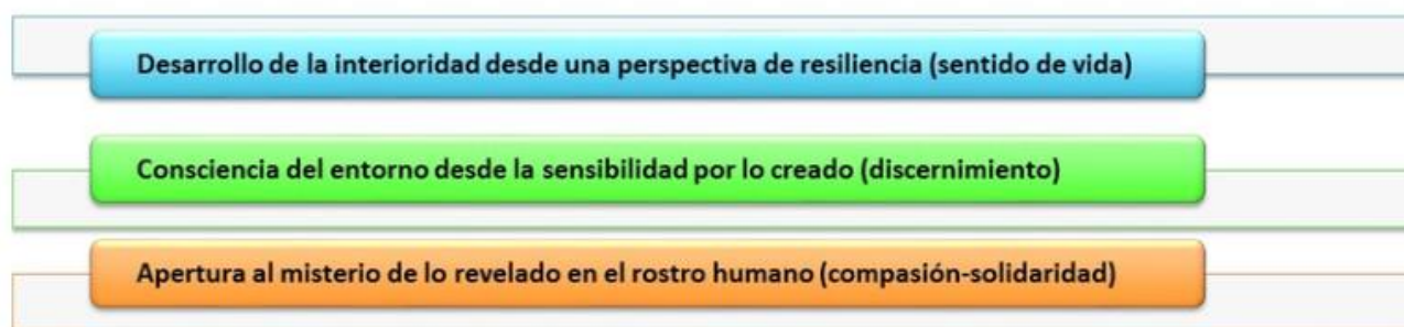
Gráfico 07: propuesta de ERE en IE

Por ello, en revisión del plan de ERE Bethlemita y las propuestas desarrolladas por autores como Torralba y del docente Ciro, en cuanto estipulan la inteligencia espiritual como un aporte significativo para el proceso pedagógico en los niños y jóvenes dentro de la incidencia de la formación integral, a continuación se genera la propuesta general de la implementación de la IE, vista como un enriquecimiento al plan general de ERE de la Institución Educativa, distinguiendo así, tres etapas para ser evidenciada en cada uno de los tópicos de cada grado, concretándose de la siguiente manera: