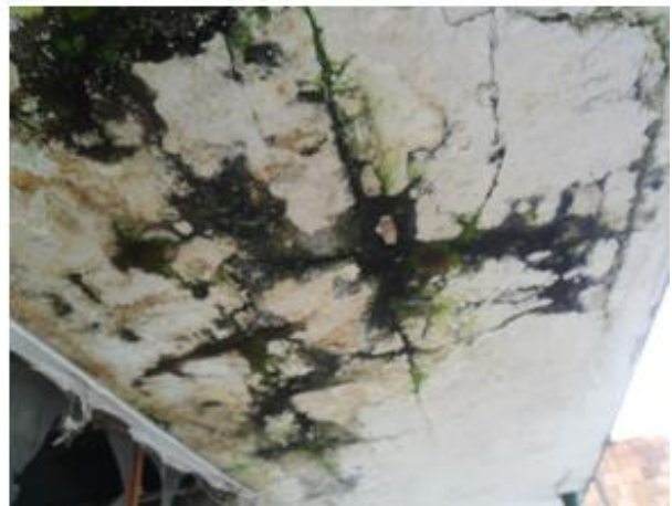
Fotografía 4. Filtraciones desde la cubierta