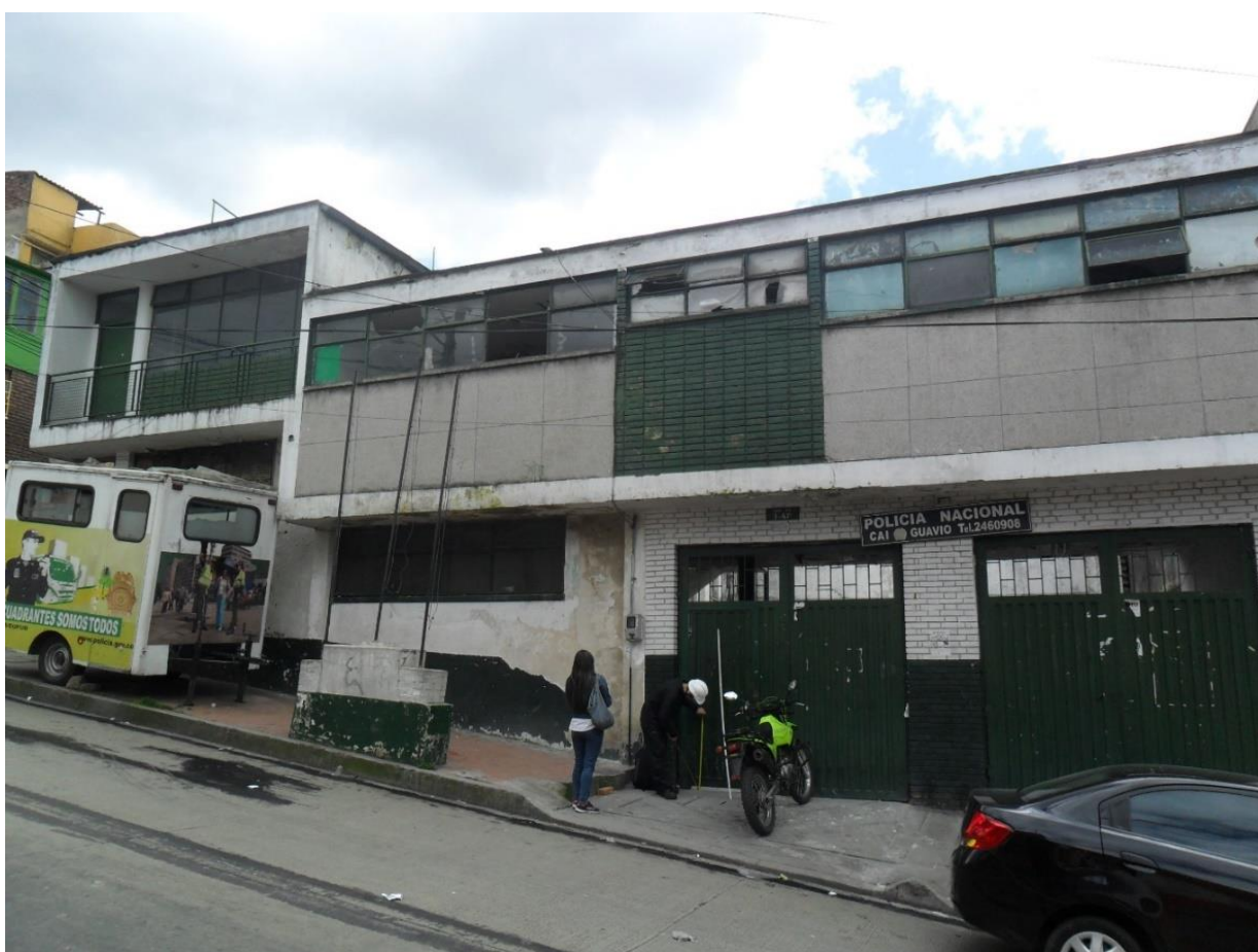
Fotografía 1. Fachada del CAI el Guavio