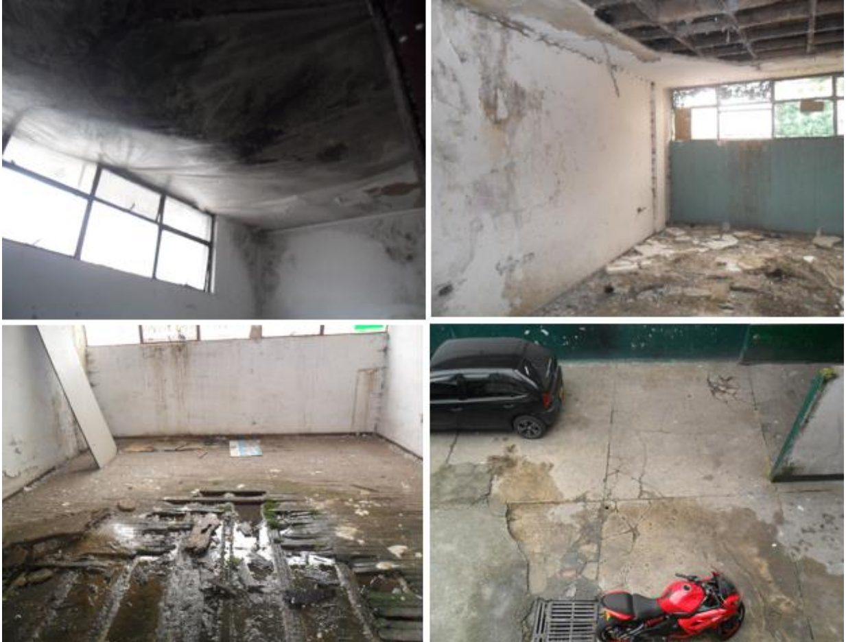
Fotografía 10. Lesiones mecánicas de la edificación