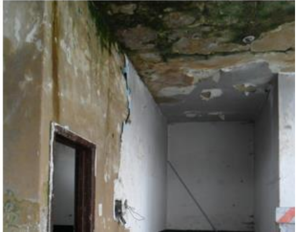
Fotografía 5. Afectación de la humedad en la edificación