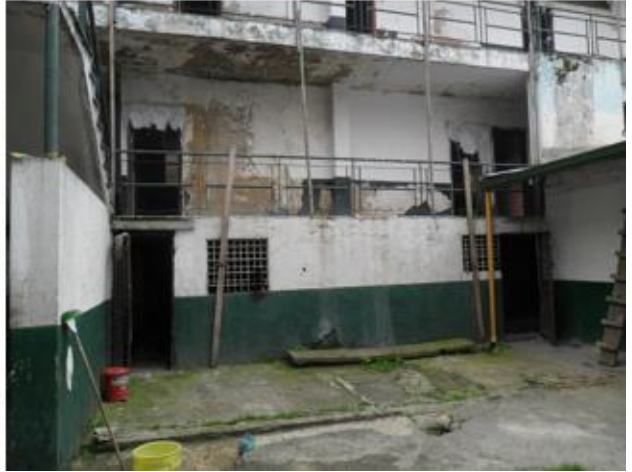
Fotografía 6. Estado actual en la edificación