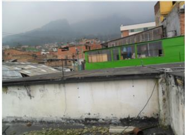
Fotografía 3. Estado de la cubierta