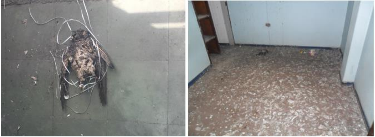
Fotografía 8. Afectación por animales en la edificación