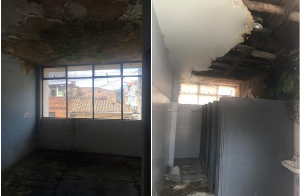
Fotografía 7. Afectación por plantas en la edificación