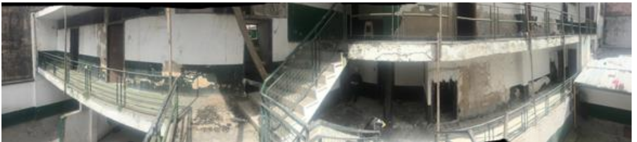
Fotografía 9. Afectación en la carpintería metálica de la edificación