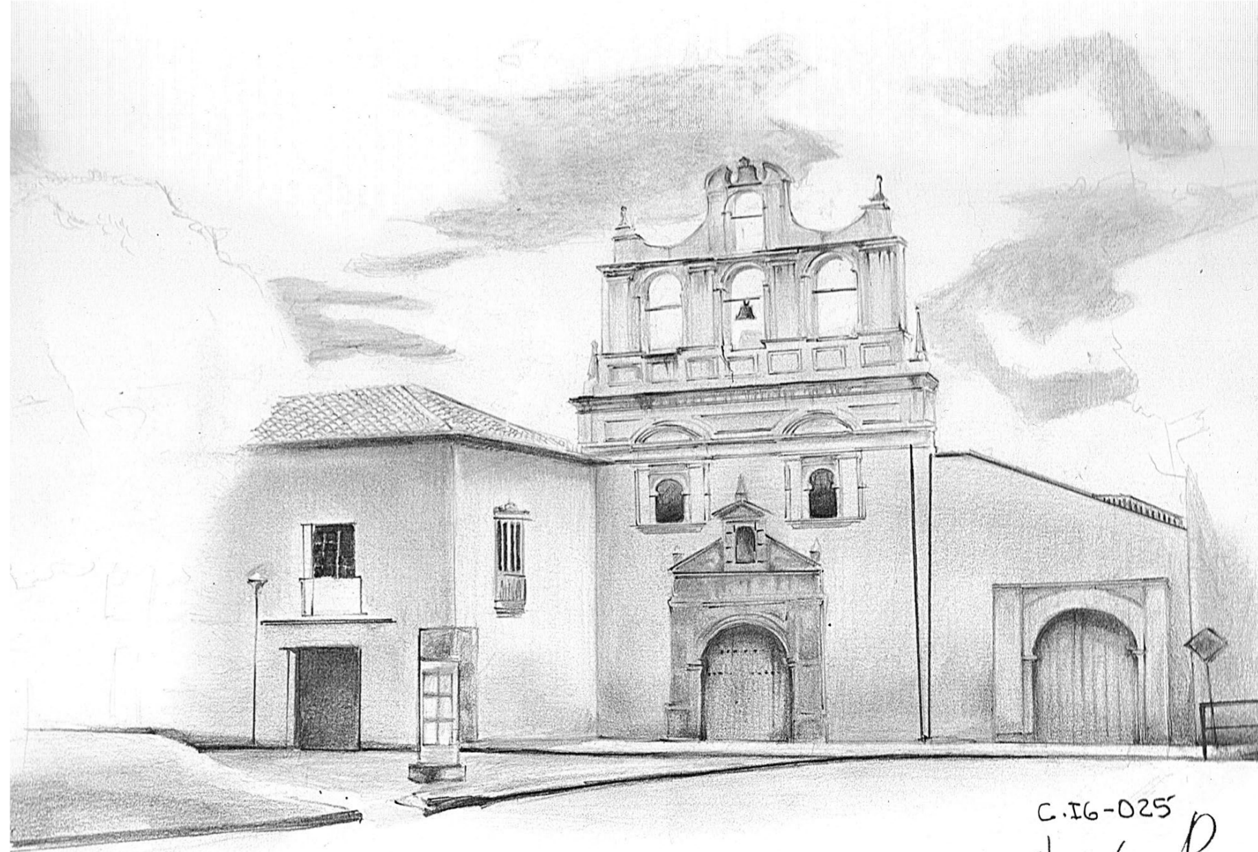
Imagen 011. Peña José Luis. Fachada Convento de San Agustín, parque Pinzón. Proyecto de Investigación Tunja Ciudad dibujada. Técnica y formato: Lápices s/ Durex 1/4. Año 2013.