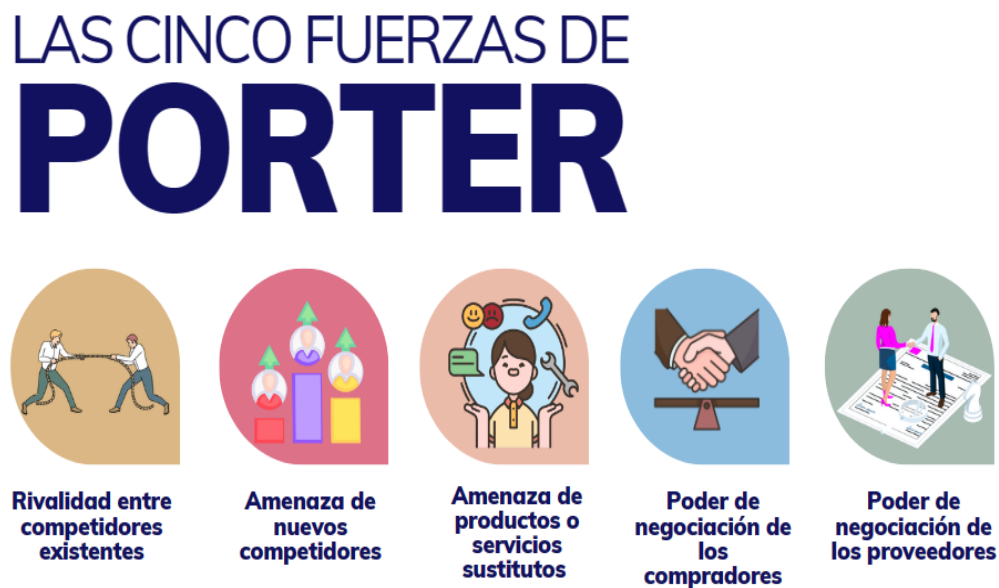
Figura 3. Matriz de las cinco fuerzas de Porter – ALS S.A.S.

La rivalidad entre competidores existentes: el grado de rivalidad entre los competidores existentes es bajo, ya que actualmente en Santander, más específicamente Bucaramanga, no hay muchas empresas que presten servicios logísticos de manera completa e integral como brinda ALS S.A.S, entonces la rivalidad es prácticamente inexistente ya que no existe tal competencia nivel local.