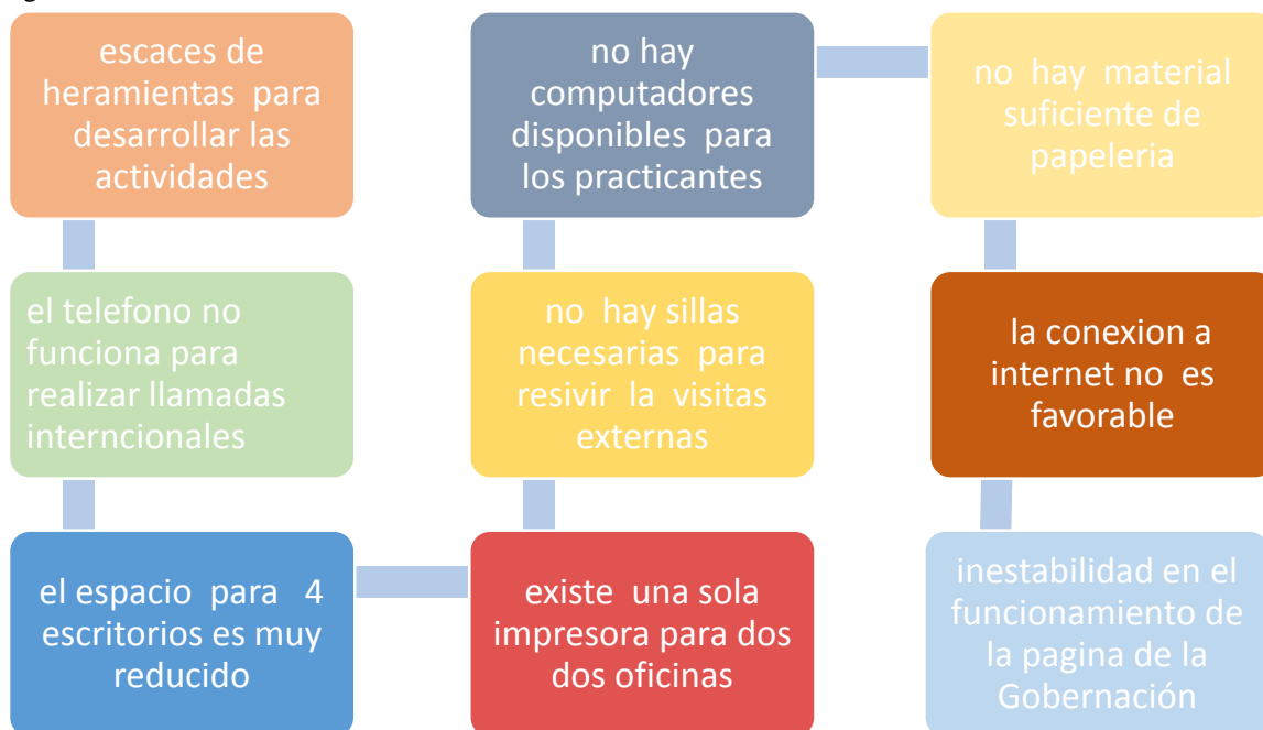
Figura 2. Dificultades en la Gestión

Además se gestionaron actividades para firmar un convenio con el país de Costa Rica; también participe en reuniones donde se dejaba planteado realizar un nuevo convenio con México enfocado en el desarrollo de clúster.