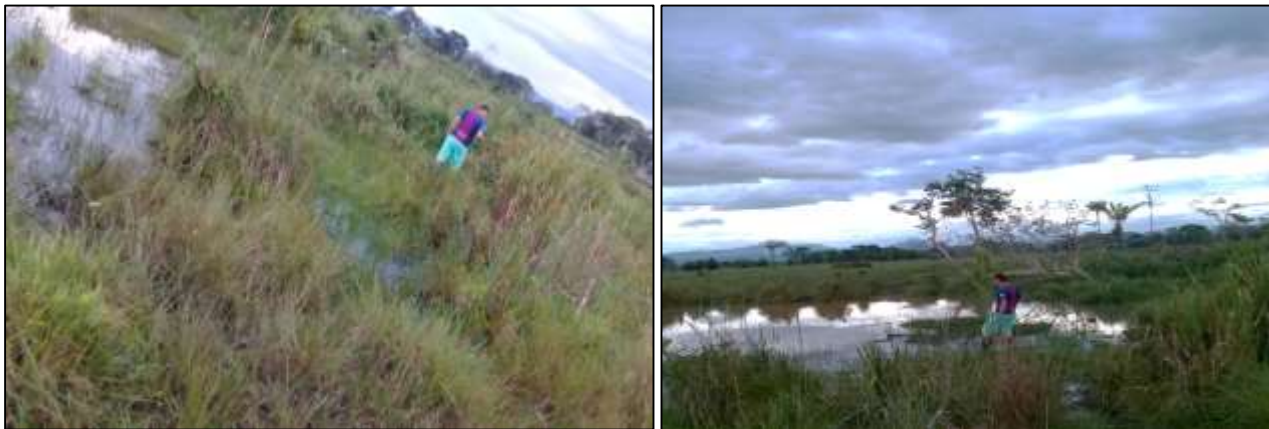
Ilustración 11. Reconocimiento del ecosistema de morichal degradado. Se hizo un reconocimiento previo del sitio, donde se pudo determinar la distancia entre la inspección la Julia y el sitio, además de las plantas existentes en el sitio y la probabilidad de riesgos naturales u otros.

Se trasplantaron 50 plantas de moriche ( Mauritia Flexuosa ) junto con la siembra de 60 plantas de nacedero ( Trichanthera Gigantea ), la cual se cortaron trozos de los tallos que se sembraron de forma vertical en el suelo.