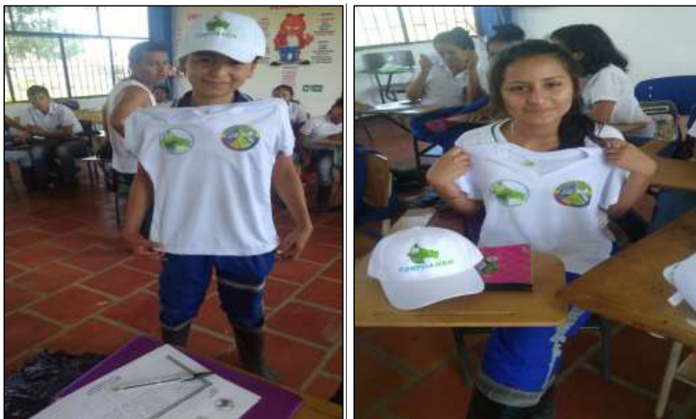
Ilustración 15. Entrega de camisetas a comité ambiental "Juventud Ambiental del Duda.

Durante la charla se habló de temas como las 3R, separación de residuos en la fuente, clasificación de los residuos sólidos y la importancia del aprovechamiento de residuos.