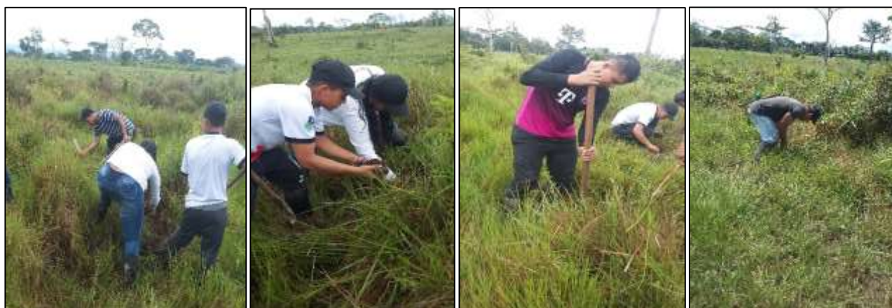
Ilustración 13. Siembra y trasplante de plantas de moriche y nacedero.

La extracción de estas plantas se hizo de un morichal que se encontraba en un predio seguido (500 m aproximadamente), de donde se extrajeron con herramientas menores y se transportaron en baldes hasta el sitio para su siembra.