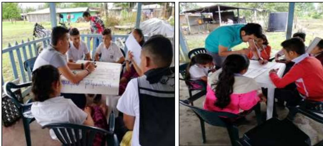
Ilustración 2. Elaboración de carteleras en mesas de trabajo.

Construir un sendero ecológico con materiales reciclados