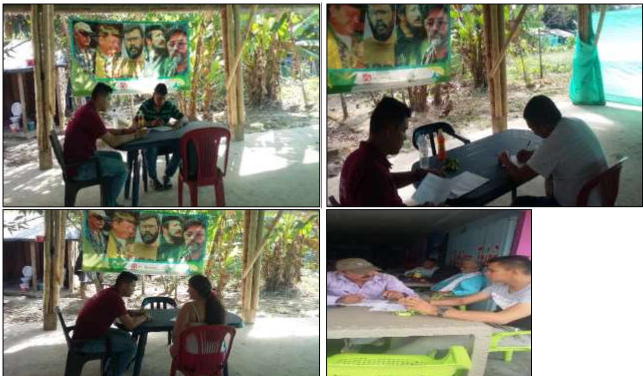
Ilustración 17. Entrevistas a excombatientes en ETCR Darío Gutiérrez. Fuente, el Autor, 2018.

En el anexo A se muestran la entrevista desarrolladas por los excombatientes.