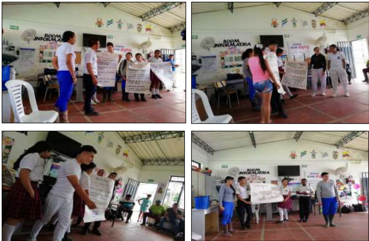
Ilustración 6. Socialización de problemáticas y actividades priorizadas por mesas de Trabajo.

Construir un relleno sanitario para no incinerar los residuos a cielo abierto.