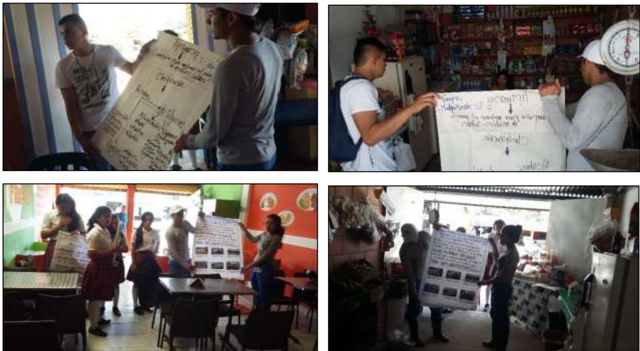
Ilustración 10. Socialización en establecimientos comerciales.