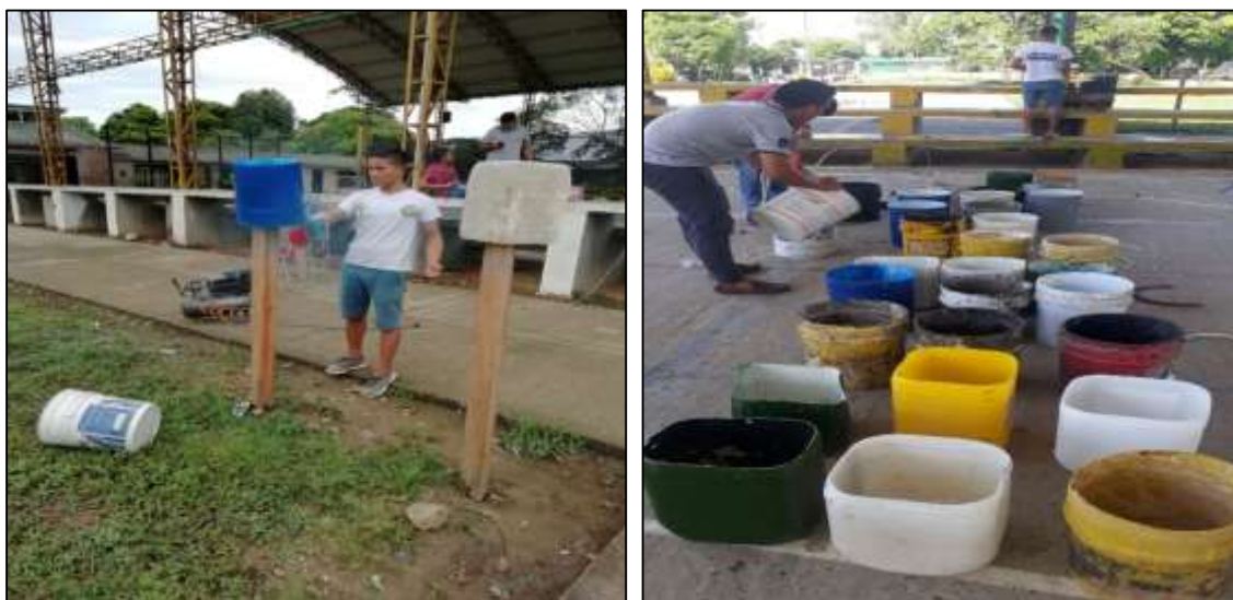
Ilustración 13. Pintado de canecas para puntos ecológicos.

Durante esta jornada el comité ambiental se encargó de instalar puntos ecológicos en sitios estratégicos del centro poblado, los cuales habían sido elaborados con canecas plásticas donadas por la comunidad y restaurados por los miembros del comité. Con esta medida se pretendía establecer puntos ecológicos en sitios como la calle principal, el parque, cancha de futbol y la biblioteca; de tal manera que con la instalación de estos 12 puntos ecológicos se redujera la disposición de estos residuos en las calles y espacios recreativos.