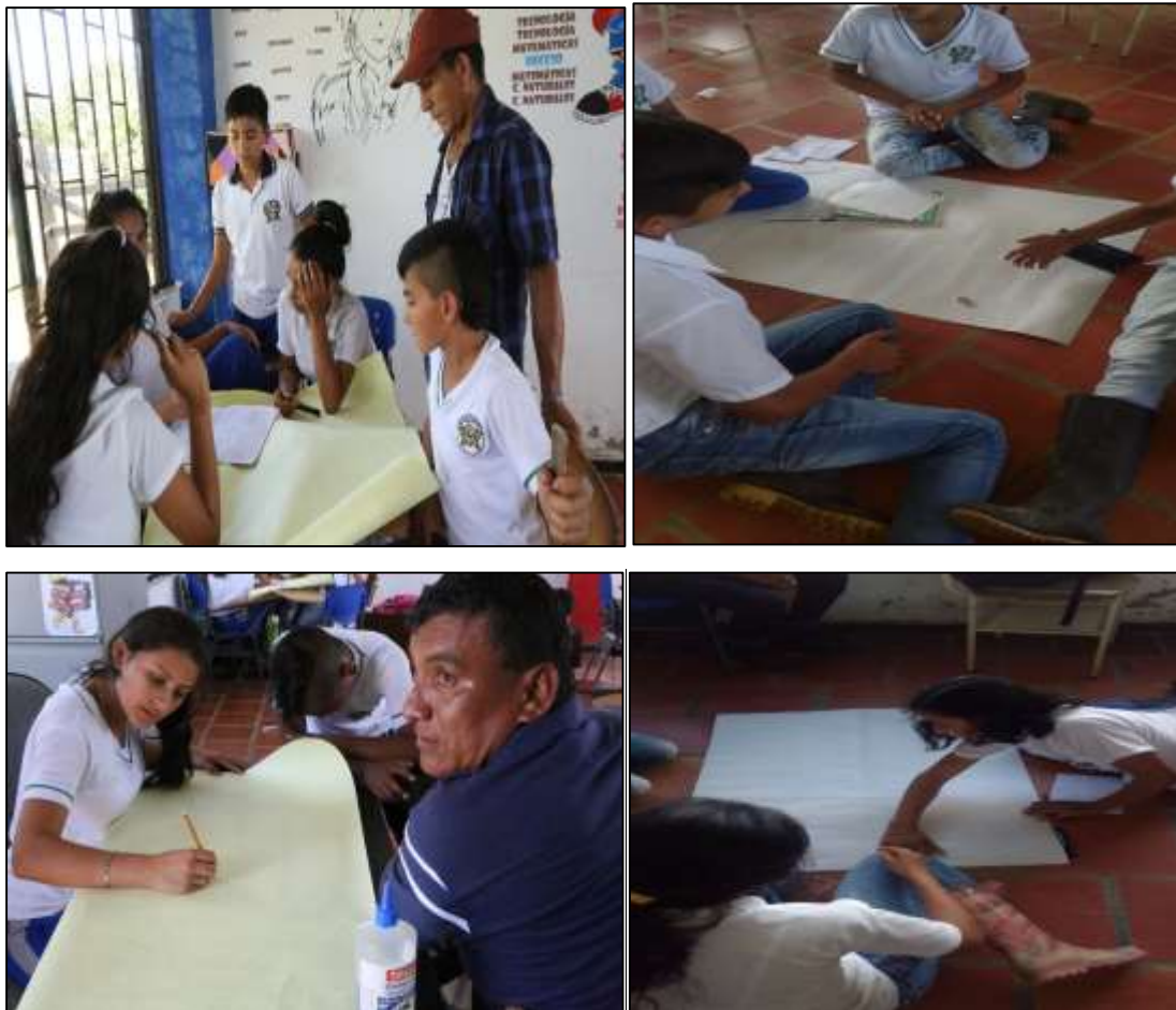
Ilustración 16. Elaboración de cartelera comité ambiental "Juventud Ambiental del Duda".

los estudiantes conocieran estos procesos y tuvieran conocimiento sobre el contexto ambiental aplicado en este ETCR. Dentro de estos proyectos destaca la construcción de un sendero ecoturístico que comprende los municipios de Uribe y Mesetas (Meta), el cual recorre por diferentes cascadas y ecosistemas de estos municipios. También se nombró la construcción de un sistema de manejo de aguas residuales y una planta para el tratamiento de basuras.