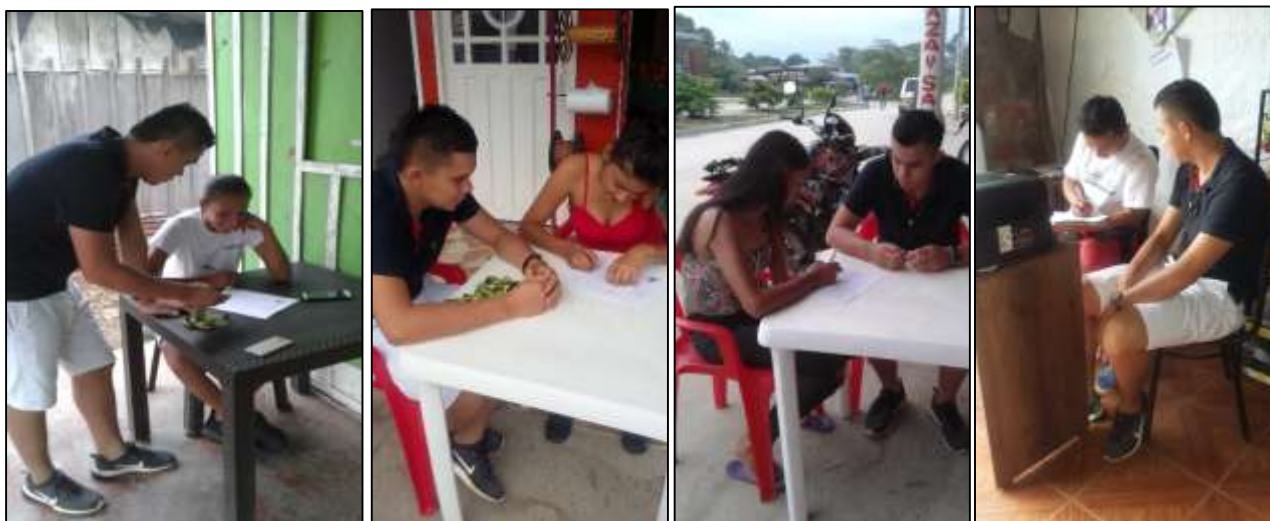
Ilustración 18. Entrevistas a miembros de comité ambiental "TIPIMASU".

En el anexo B se muestra las entrevistas desarrolladas por parte de los miembros del comité ambiental “TIPIMASU”.