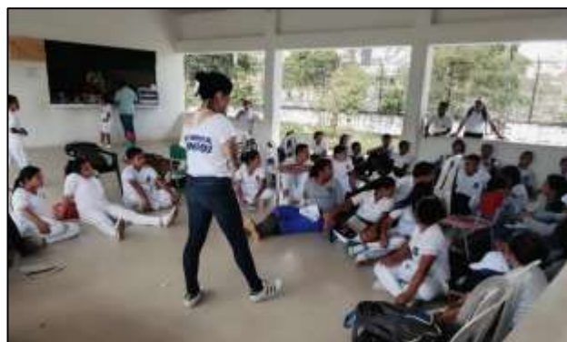
Ilustración 9. Resocialización de temas a exponer en establecimientos comerciales. Fuente, el Autor, 2018.