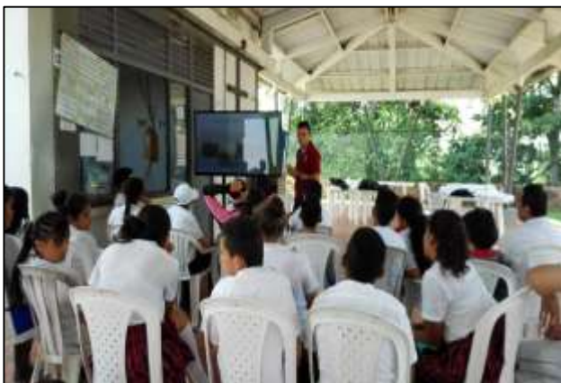
Ilustración 7. Clasificación de residuos sólidos y separación en la fuente.