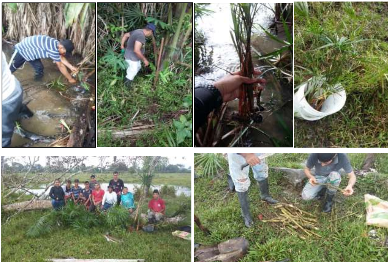
Ilustración 12. Extracción de plantas de moriche y nacedero.

La extracción de estas plantas se hizo de un morichal que se encontraba en un predio seguido (500 m aproximadamente), de donde se extrajeron con herramientas menores y se transportaron en baldes hasta el sitio para su siembra.