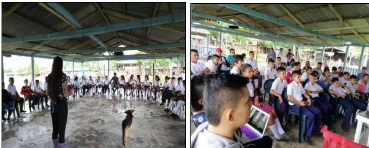
Ilustración 1. Saludo y Proyección de Video Sobre el AMEM, fuente, el Autor, 2018.

En esta actividad, realizada por el Representante Legal de la corporación CORPOAMEM, se llevó a cabo la socialización del Programa “Ambientes para la Paz”, donde se hizo referencia a los objetivos de conformar dos comités ambientales en la inspección La Julia (municipio de Uribe, Meta) y el centro poblado Muribá (Municipio de Mesetas, Meta). Así mismo se presentó el proyecto y los actores sociales con los que se iba a llevar a cabo: estudiantes de la Institución Educativa La Julia y el Centro Educativo Brisas del Duda, así como la inclusión de algunos excombatientes de las FARC EP.