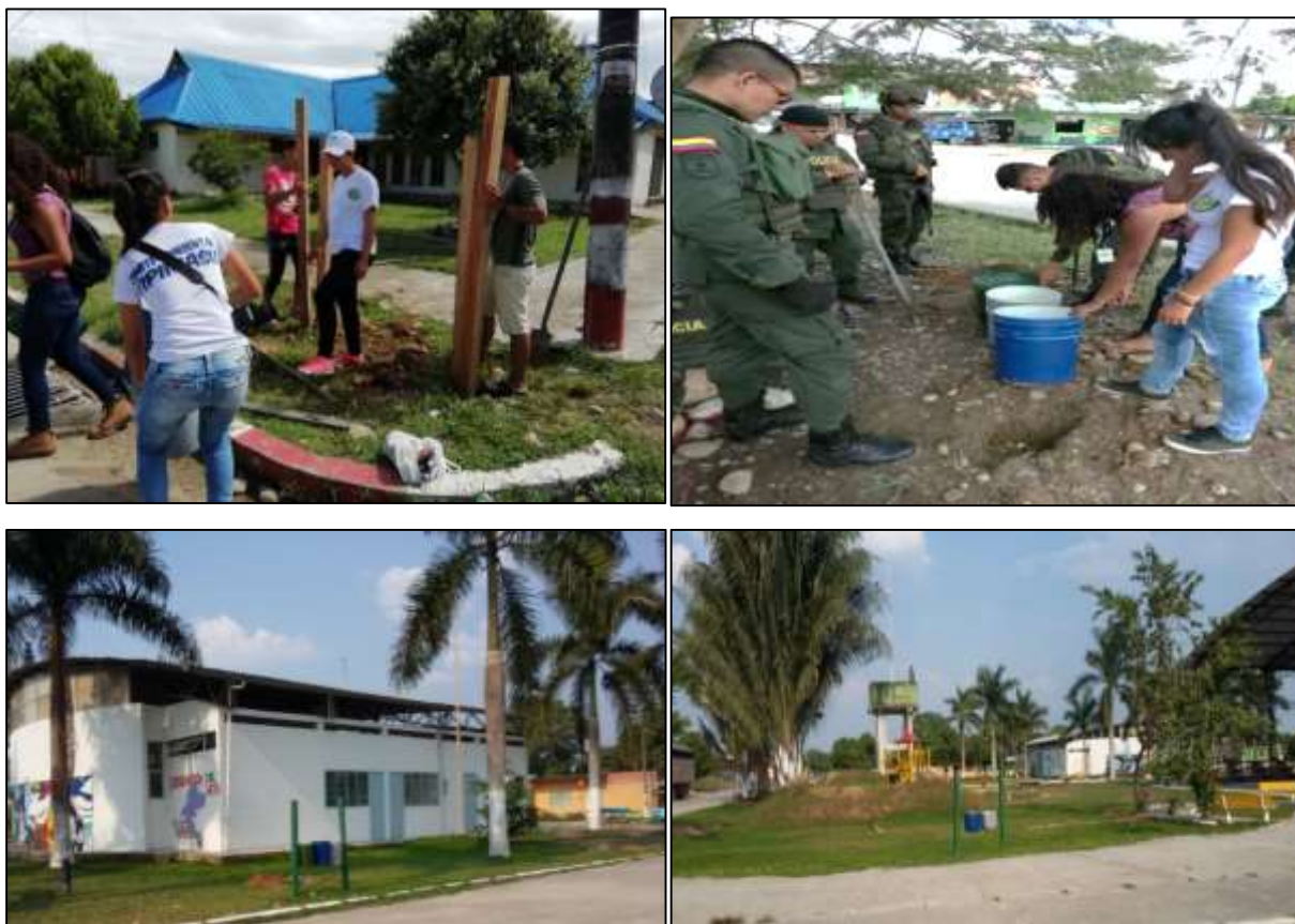
Ilustración 14. Instalación de puntos ecológicos en la inspección La Julia.