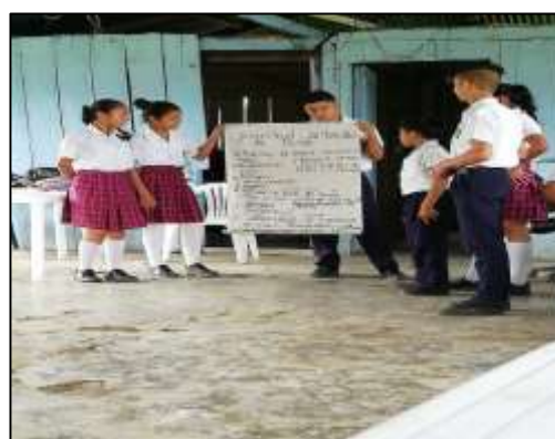
Ilustración 3. socialización de actividades por mesas de Trabajo.

Al final de la jornada se hizo la selección de forma democrática por el nombre del comité ambiental y su respectivo lema, el cual quedó establecido “Juventud Ambiental del Duda”, con el lema, “Todos por un ambiente sano”.