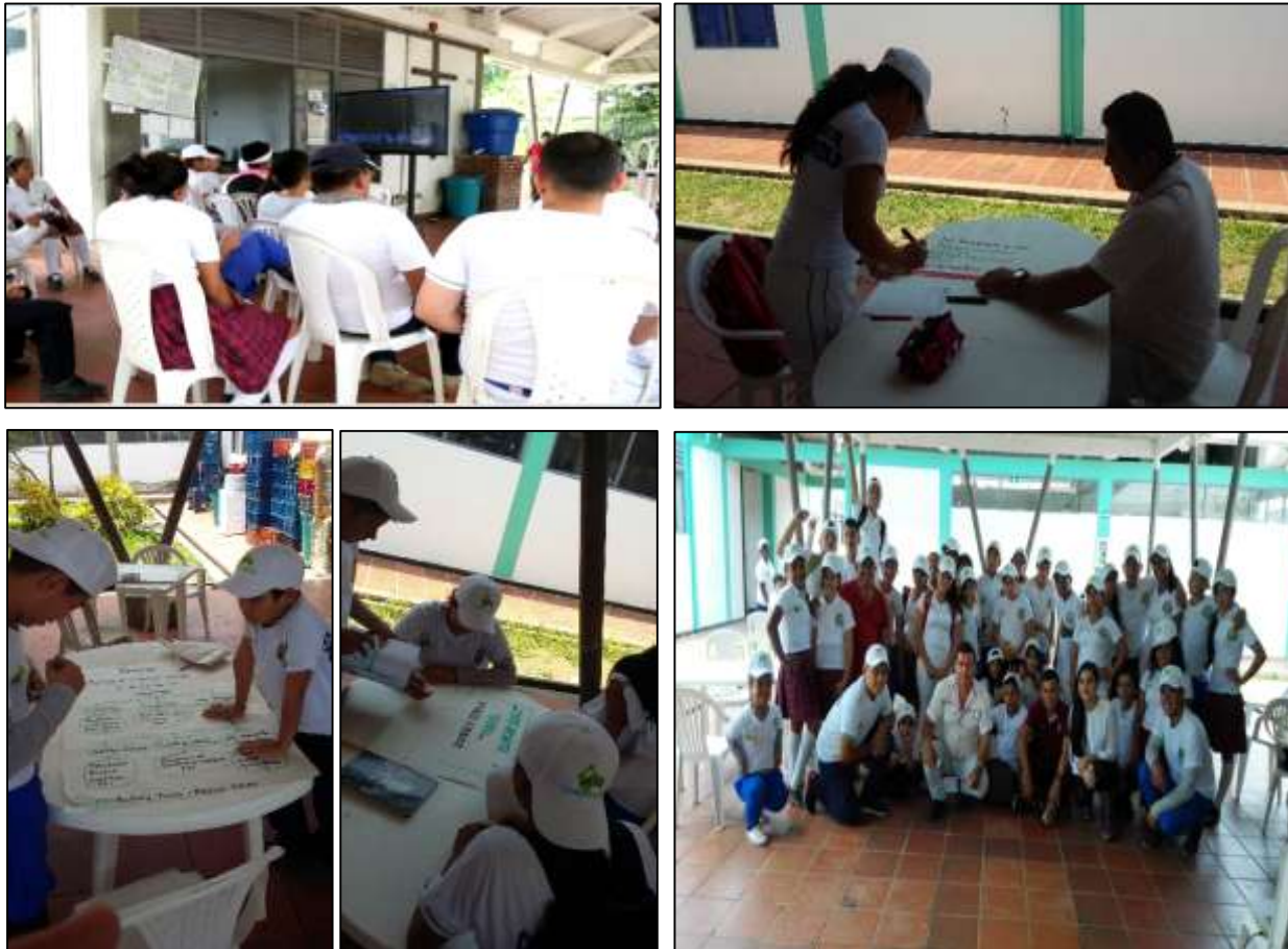
Ilustración 8. Proyección de documental y realización de carteleras.