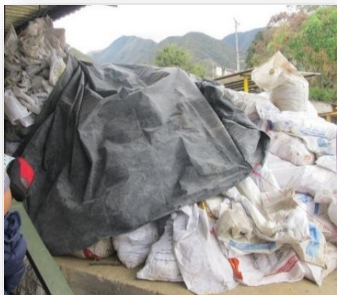
Ilustración 1. Acumulación de saquillas o costales en la planta de beneficio