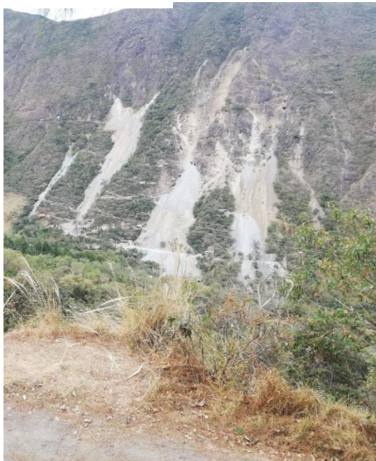
Ilustración 3. Proceso de remoción

Respecto al componente suelo y subsuelo, se identificaron procesos de remoción de cobertura vegetal, erosión localizada y generación de drenajes ácidos asociados a la exposición de sulfuros, particularmente en zonas con arsenopirita, lo cual coincide con la caracterización mineralógica previamente analizada. Esto favorece la liberación de arsénico en La Llanada y de antimonio y plomo en zonas de Los Andes–Sotomayor.