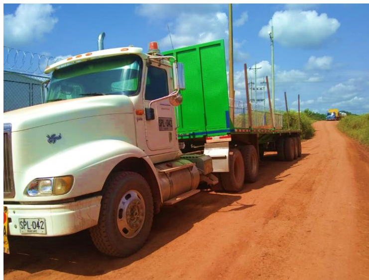
Figura 5. Tractocami3n cama alta. Adaptada de: (Leidy Susana Vanegas Marca, 2020).