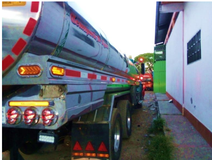
Figura 7. Carrotanque. Adaptación de: (Leidy Susana Vanegas Marca, 2020).