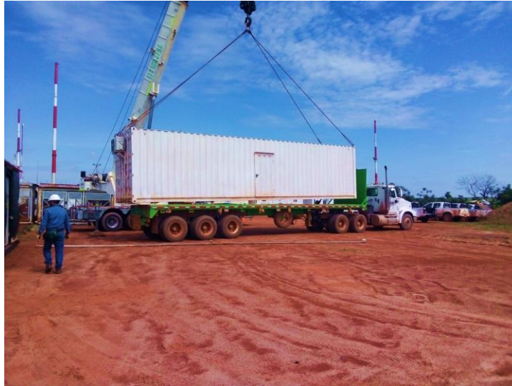
Figura 2. Transporte de Carga. Adaptada de: (Leidy Susana Vanegas Marca, 2020).