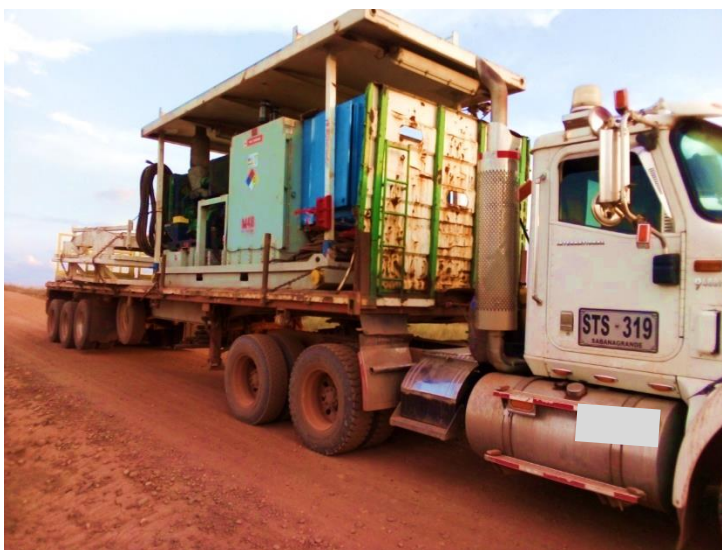
Figura 3. Carga Sobredimensionada. Adaptada de: (Leidy Susana Vanegas Marca, 2020).