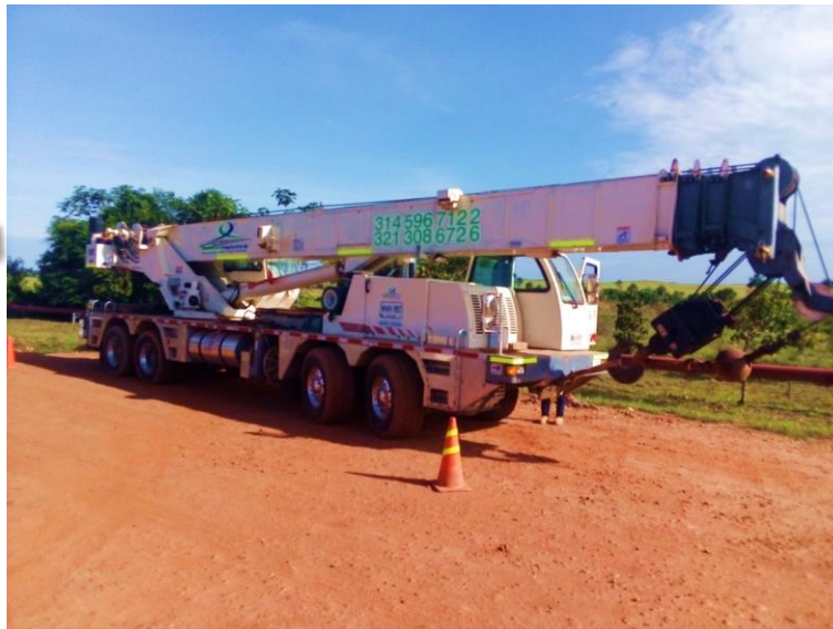
Figura 4. Grúa Telescópica. Adaptada de: (Leidy Susana Vanegas Marca, 2020).