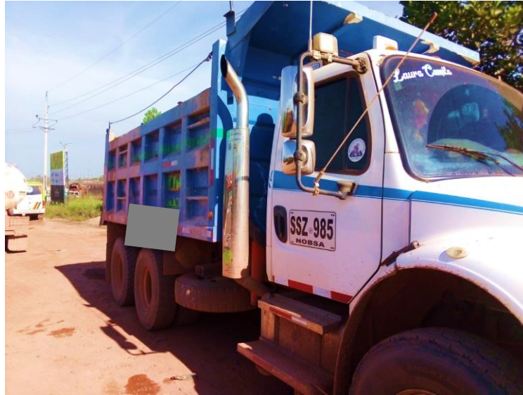
Figura 8. Volqueta abierta. Adaptada de: (Leidy Susana Vanegas Marca, 2020).