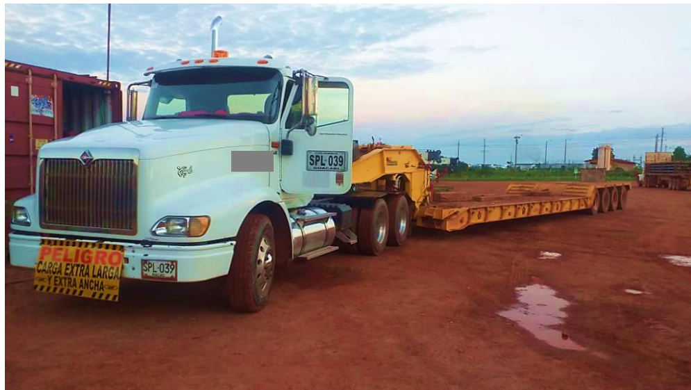
Figura 6. Tractocamión cama baja. Adaptada de: (Leidy Susana Vanegas Marca, 2020).