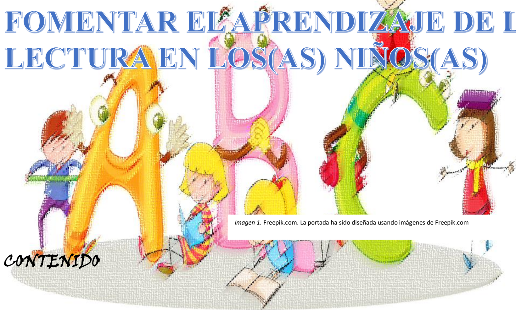
Imagen 1. Freepik.com. La portada ha sido diseñada usando imágenes de Freepik.com