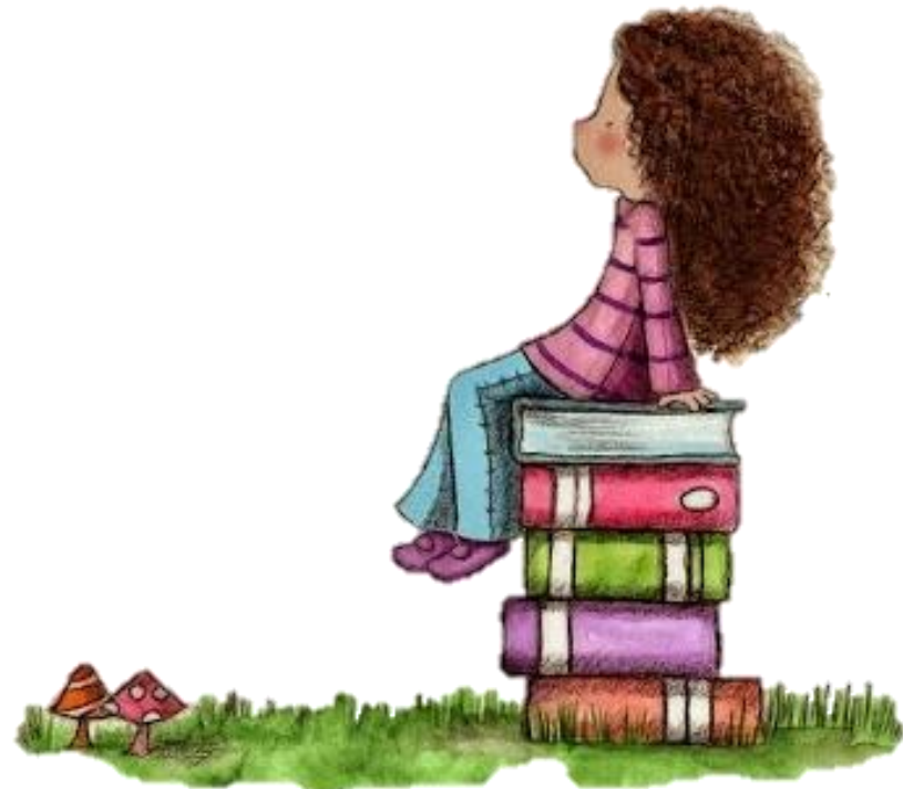
Imagen 2. Niña sentada.

¡A cocinar! Busca recetas de cocina sencillas, ilustradas y escritas. Dáselas a los niños para que ellos identifiquen los ingredientes y los busquen. Guíalos para que vayan preparando la receta según las instrucciones. Luego, ¡a comer!