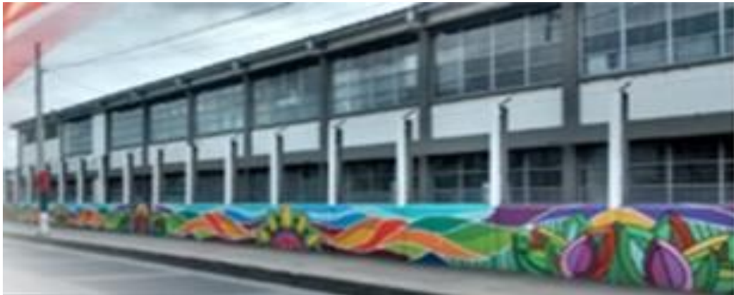
Figura 1. Institución Educativa Seminario