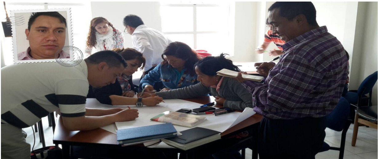
Figura 1. Evidencia de la Cartografía Social de la Institución Educativa Seminario.

en palabras del rector: “los estudiantes puedan acceder a sus estudios universitarios”. En este sentido se hizo necesario implementar una propuesta didáctica que apunte hacia la promoción lectora y que mejor cultive en los niños acercarse a ella, no por obligación, sino que vean en ella un disfrute lector, el cual también redundará en los logros académicos que busca la institución educativa.