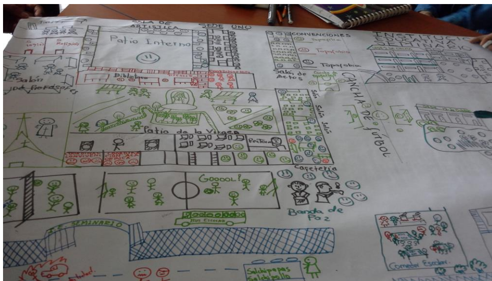
Figura 2. Cartografía