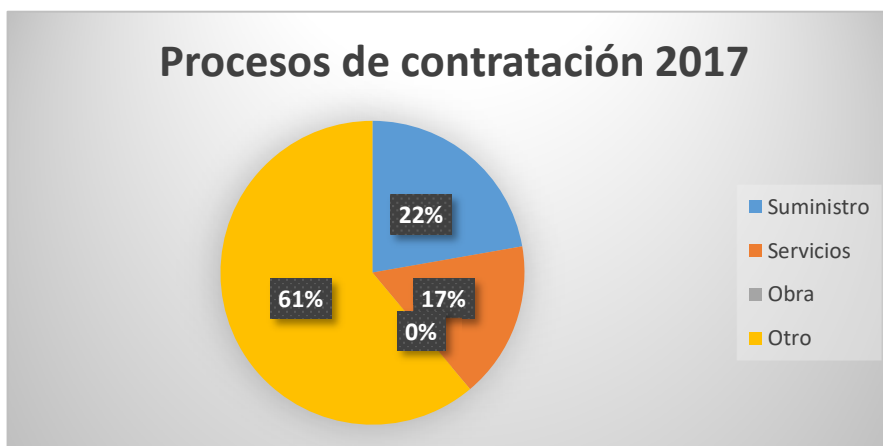
Figura 2. Procesos de Contratación 2017