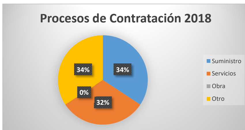
Figura 3. Procesos de Contratación 2018