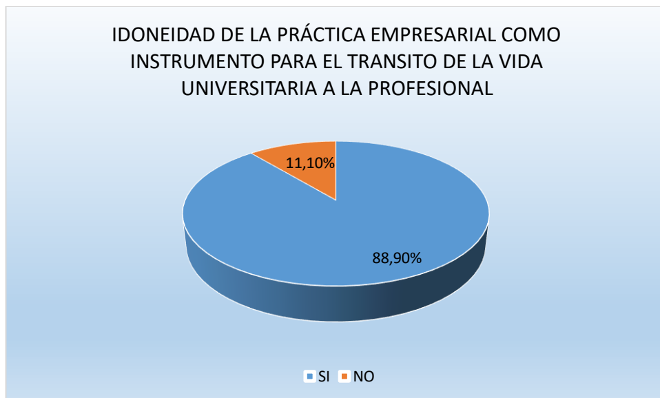
Figura 4. Considera usted que el desarrollo de la práctica empresarial es el instrumento idóneo para el tránsito de la vida universitaria a la formación profesional. Fuente: Encuesta propia aplicada a través de Google forms a estudiantes egresados no graduados de la Universidad Santo Tomas de Tunja, quienes eligieron y culminaron como opción de grado la realización de práctica empresarial.

El 88.8% de los estudiantes encuestados acepta como cierto que la práctica empresarial es esencial para el tránsito de la vida universitaria a la profesional, teniendo en cuenta que en este trascurso se pueden tener distintas vivencias, oportunidades y hechos que lo formen en un futuro como gran profesional. Ahora, teniendo en cuenta que la pregunta contaba con su explicación, se mencionarán algunas respuestas que afirman lo referido.