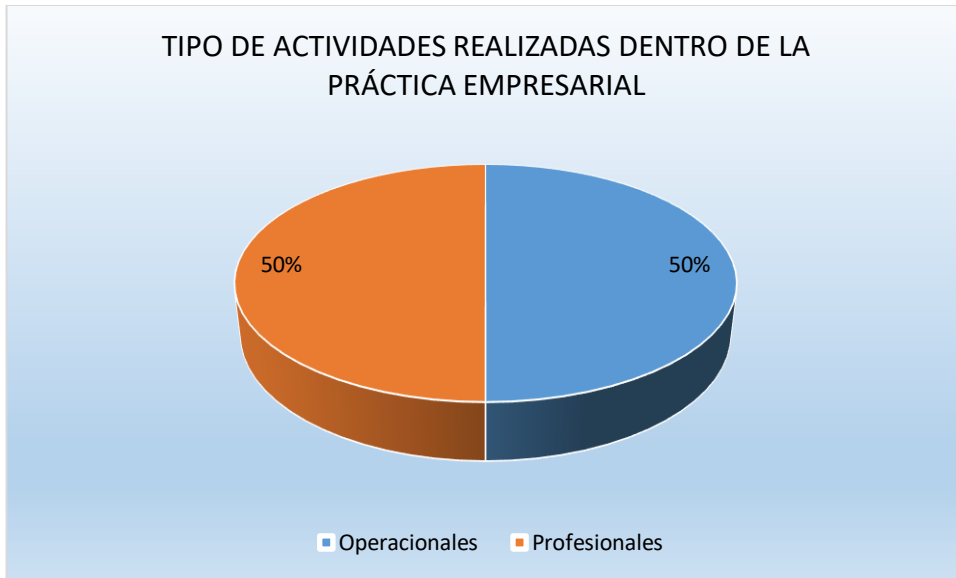
Figura 3. Considera usted que las actividades realizadas dentro de su práctica empresarial para el desarrollo de sus funciones fueron.

A partir del resultado obtenido se concluye que, dentro del desarrollo de las prácticas empresariales realizadas por los educandos de la Facultad de Negocios Internacionales de la Universidad Santo Tomas de Tunja, el 50% de los estudiantes logran poner en práctica los conocimientos adquiridos en el ente universitario, ahora, el otro 50% no lo hace de esta manera, por cuanto se evidencia una falencia de los procesos universidad- empresa en el desarrollo de la práctica empresarial, toda vez que la mitad de los practicantes, se limitó a desarrollar funciones operativas y no pudo poner en práctica los conocimientos de nivel profesional adquiridos en la universidad.