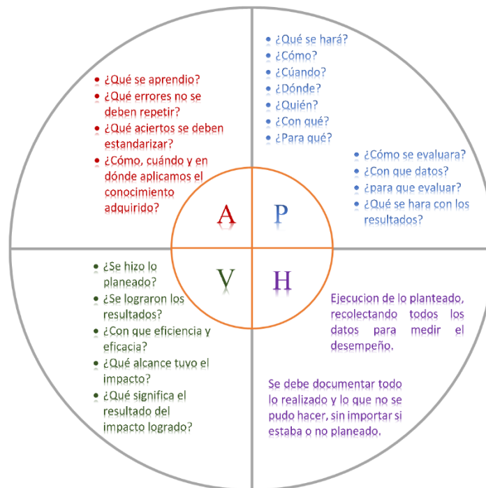
Figura 5. Ciclo PHVA para la realización de prácticas empresariales. Fuente: (Deming, 1950)