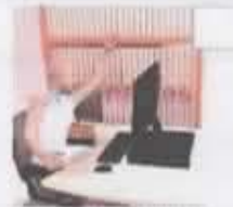
Se deben alcanzar objetos alejados o por encima del nivel de la cadera.