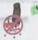
Además, indica si: