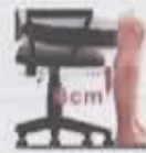
Respecto a la profundidad del asiento, indica la situación.