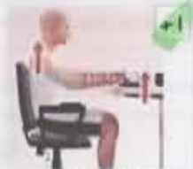
El teclado está demasiado alto. Los hombros están encogidos.