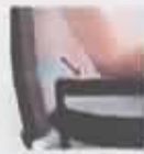
Además, indica si: