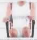
Respecto a los reposabrazos, indica la situación.