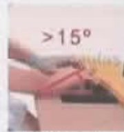
Las muñecas están extendidas más de 15°.