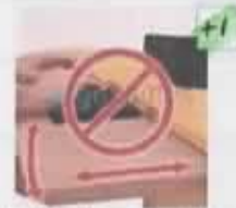
El teclado, o la plataforma sobre la que reposa, no son ajustables.