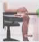
Además, indica si: