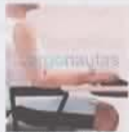
Las muñecas están rectas y los hombros relajados.

Respecto al teclado, indica la situación