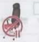
Además, indica si: