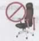
Además, indica si: