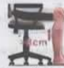
Respecto a la profundidad del asiento, indica la situación.