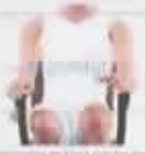
Respecto a los reposabrazos, indica la situación.