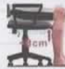
Respecto a la profundidad del asiento, indica la situación.