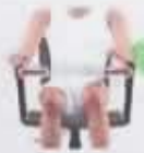
Además, indica si: