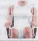
Respecto a los reposabrazos, indica la situación.