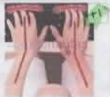
Las muñecas están desviadas lateralmente hacia dentro o hacia afuera.