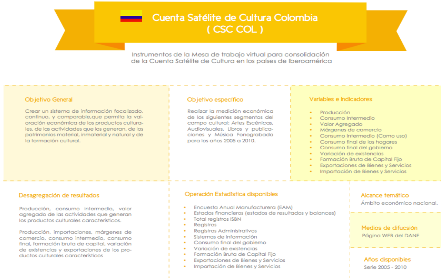
Diagrama 3. Mapa de información de la Cuenta Satélite de Cultura de Colombia