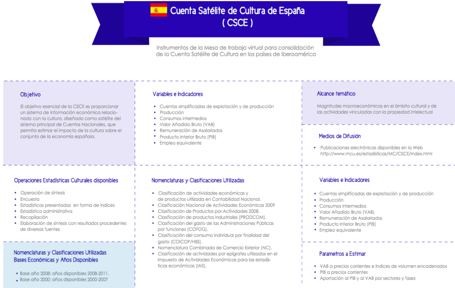
Diagrama 1. Mapa de información de la Cuenta Satélite de Cultura de España