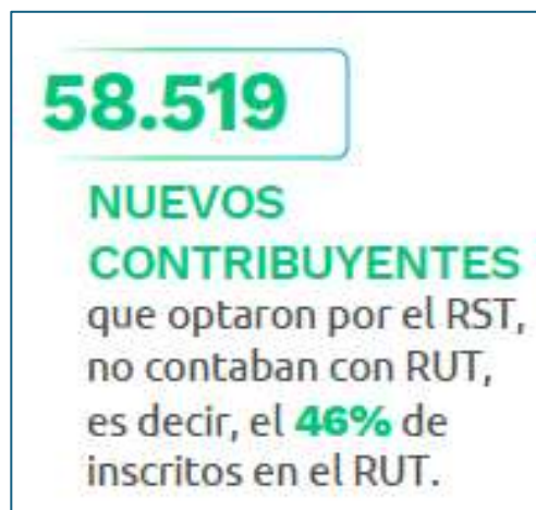
Figura 5 Nuevos contribuyentes

Nota. Adaptado de (Dirección de Impuestos y Aduanas Nacionales (DIAN), 2023b, p. 2)