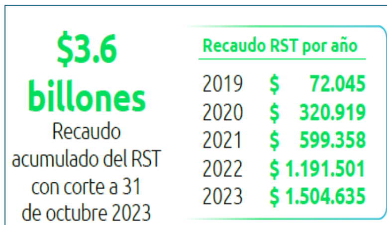
Figura 7 Recaudo por el Régimen Simple de tributación

Nota. Adaptado de (Dirección de Impuestos y Aduanas Nacionales (DIAN), 2023b, p. 5)