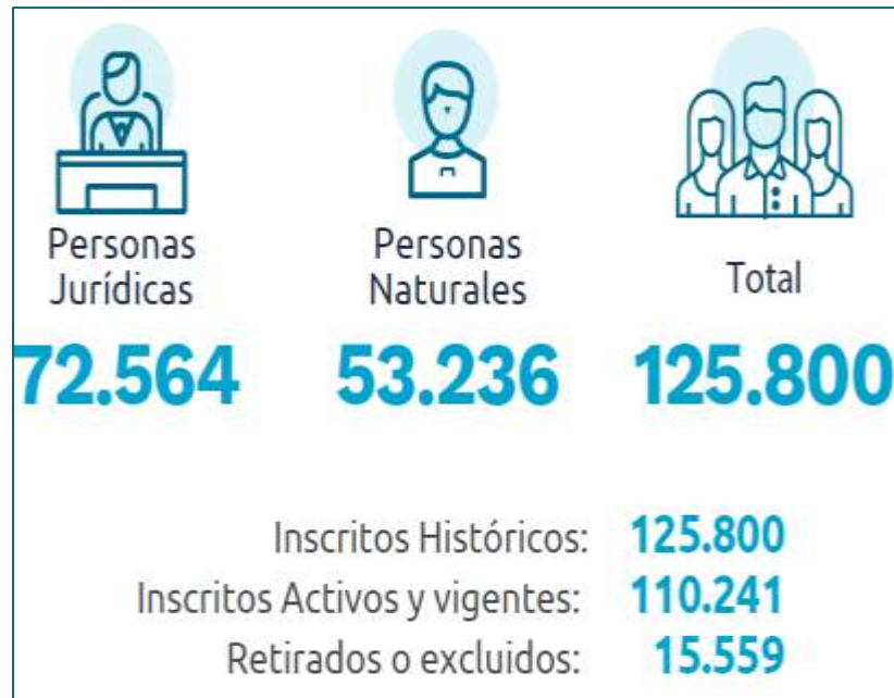
Figura 3 Inscritos en general en RST

Nota. Adaptado de (Dirección de Impuestos y Aduanas Nacionales (DIAN), 2023b, p. 2)