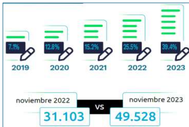
Figura 4 Comportamiento de inscripción al RST

Nota. Adaptado de (Dirección de Impuestos y Aduanas Nacionales (DIAN), 2023b, p. 2)