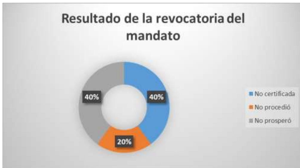
Figura 4. Gráfica que muestra el estado en que quedó el intento de la revocatoria del mandato en los municipios del Meta. Información obtenida de la Registraduría Nacional del Registro Civil.