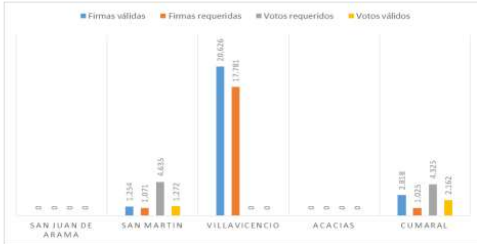
Figura 3. Gráfica que muestra la cantidad de votos obtenidos en los municipios en los cuales hubo elecciones, no alcanzando el umbral necesario para prosperar la revocatoria el mandato. Información obtenida de la Registraduría Nacional del Estado Civil.