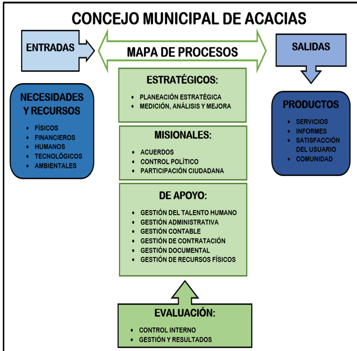
Figura 1. Mapa de Procesos del Concejo Municipal de Acacias.