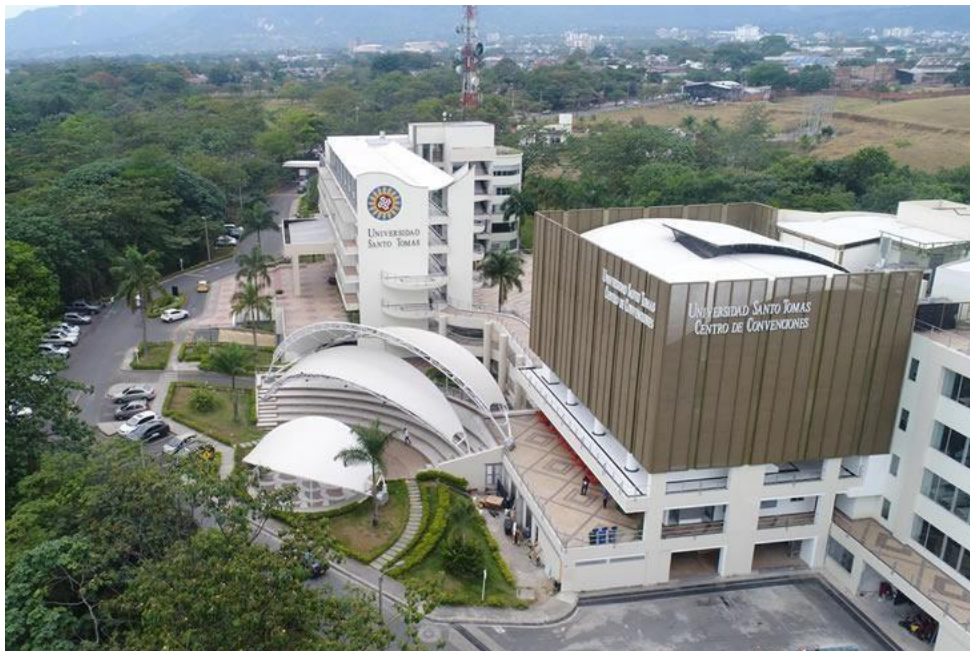
Figura 3. Foto de la Sede Aguas Claras, Villavicencio

Nota. Adaptado de la Universidad Santo Tomás, 2021