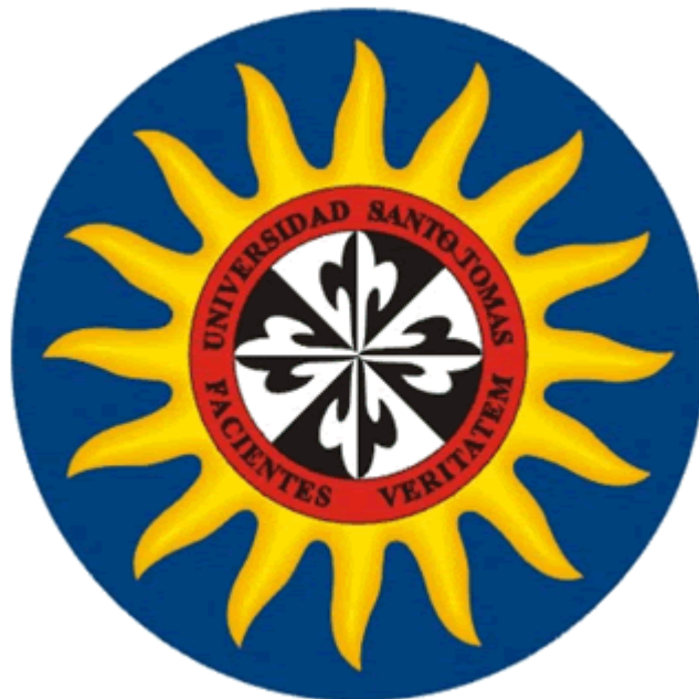
Figura 2. Logo Universidad Santo Tomás

Nota. Adaptado de la Universidad Santo Tomás, 2021