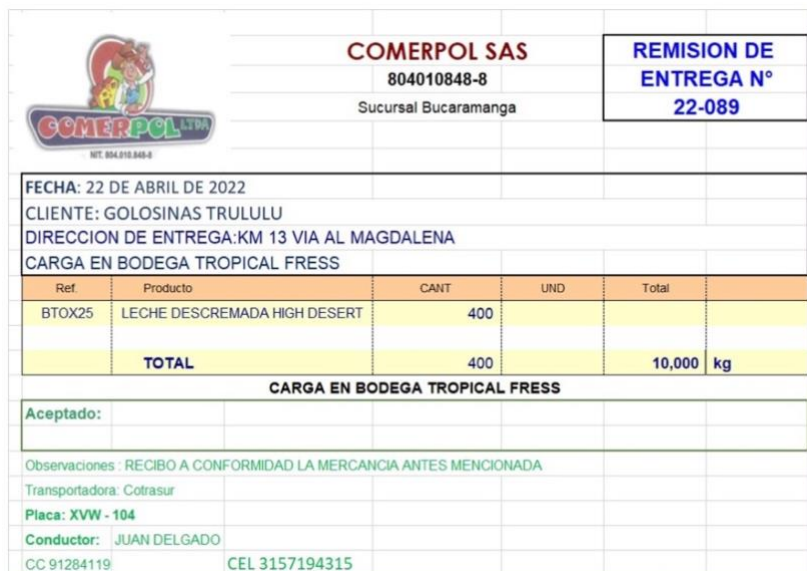
Figura 4. Remesa de transporte nacional realizado por la auxiliar de importaciones