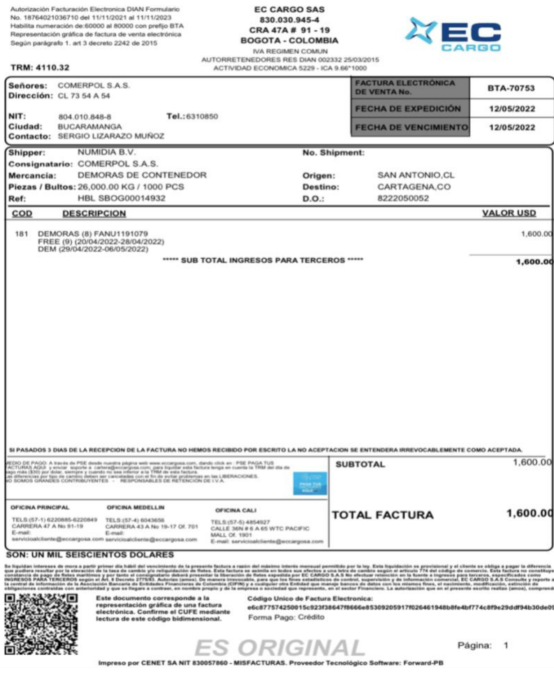
Figura 8. Factura por días de demora en el puerto