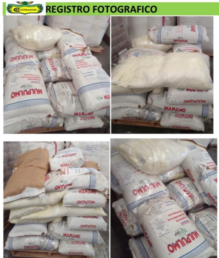
Figura 9. Registro fotográfico de averías emitido por la transportadora