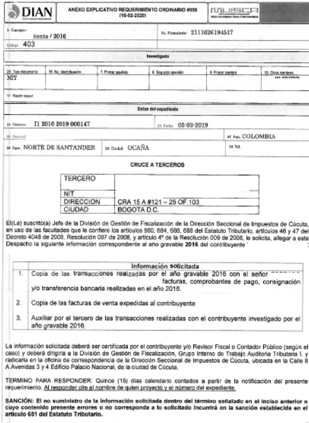
Figura 5. Anexo explicativo de Requerimiento ordinario, Obtenido dian web notificaciones