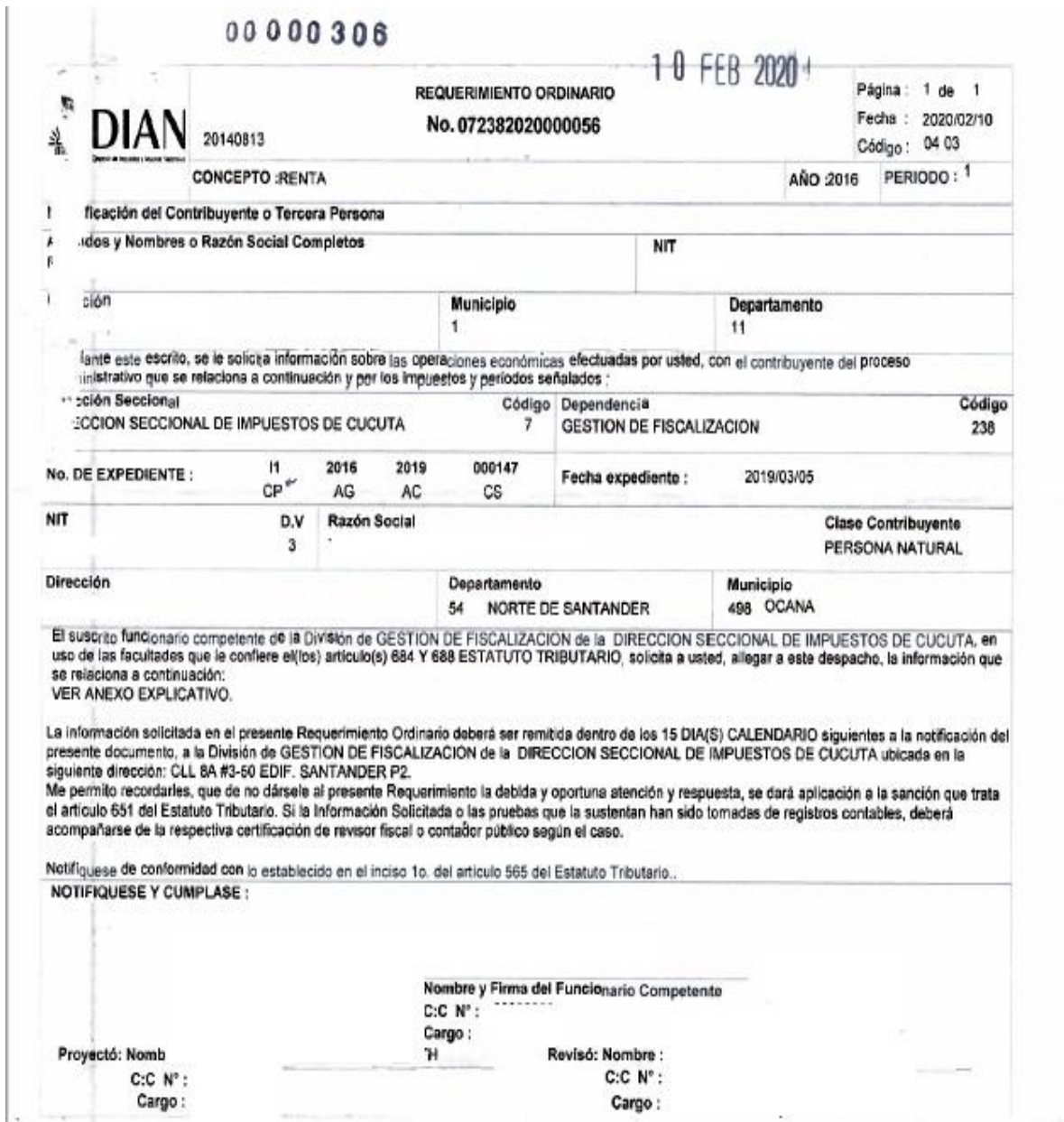
Figura 4. Requerimiento ordinario , Obtenido dian web notificaciones