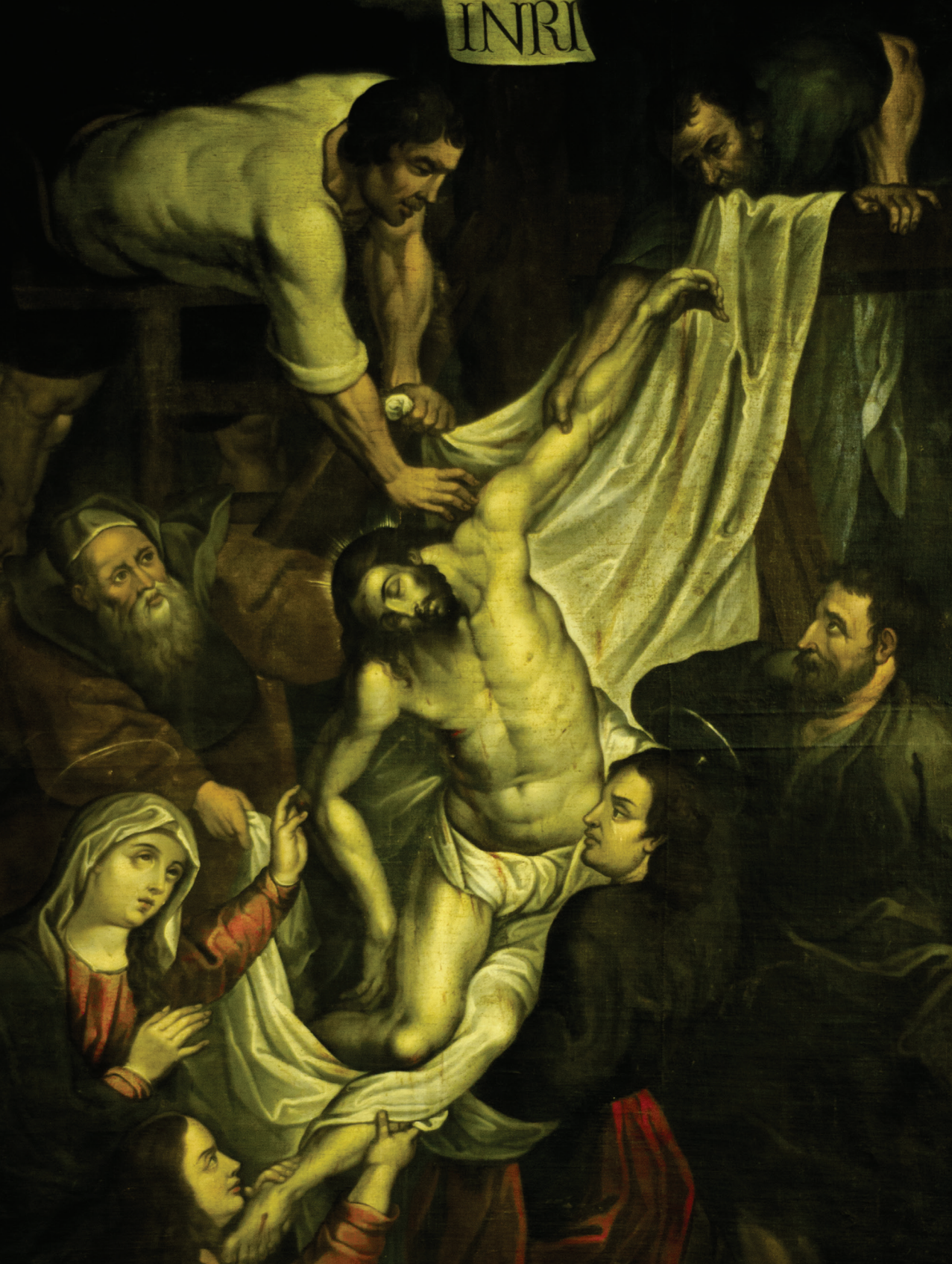
Figura 3. Angelino Medoro. (Siglo XVI), Descendimiento de la cruz . Óleo sobre tela. Colección Convento Santo Domingo de Guzmán. Bogotá: Archivo del Instituto de Estudios Socio-Históricos Fray Alonso de Zamora.