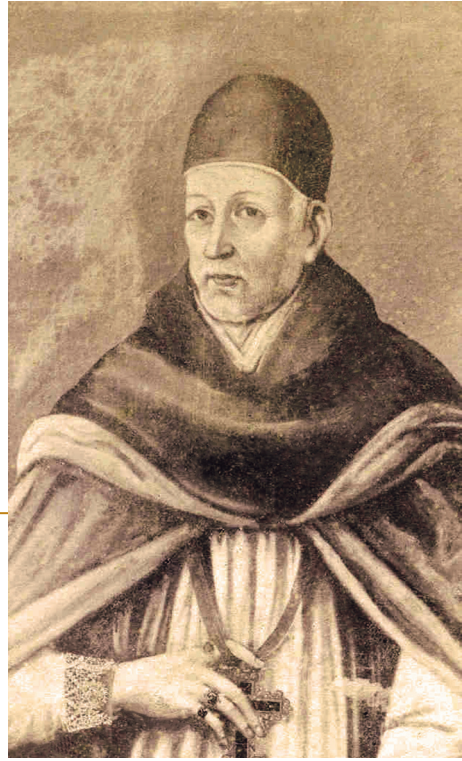
Figura 4. Anónimo. (s. f.). Fray Luis Zapata de Cárdenas . En: Galería de notabilidades colombianas . Bogotá: Biblioteca Luis Ángel Arango. Fi 203.

Pero antes que el gobierno civil diera cumplimiento a la taxativa medida, Zapata de Cárdenas se constituyó en el principal vocero de la misma sujetando a su mando la distribución de prebendas y cargos eclesiásticos.