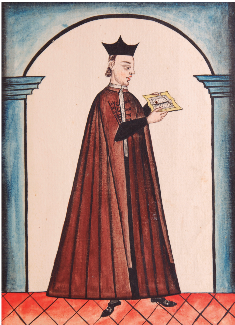
Figura 5. Baltasar Jaime Martínez de Compañón. (1791). Seminarista . En: Codex Trujillo. Colección original inédita de mapas relativos al obispado de Perú: retratos en colores y dorados de arzobispos, virreyes y otros personajes del Perú . Manuscrito. Bogotá: Biblioteca Nacional de Colombia. Fondo: Antiguo. RM216.