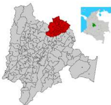
Figura 1. Mapa del departamento de Cundinamarca ubicando el municipio de Ubaté

a formación familiar hay diversidad madres cabeza de hogar, padre y madre, padres y abuelos, donde el niño desempeña un rol afectivo y centro de la familia.