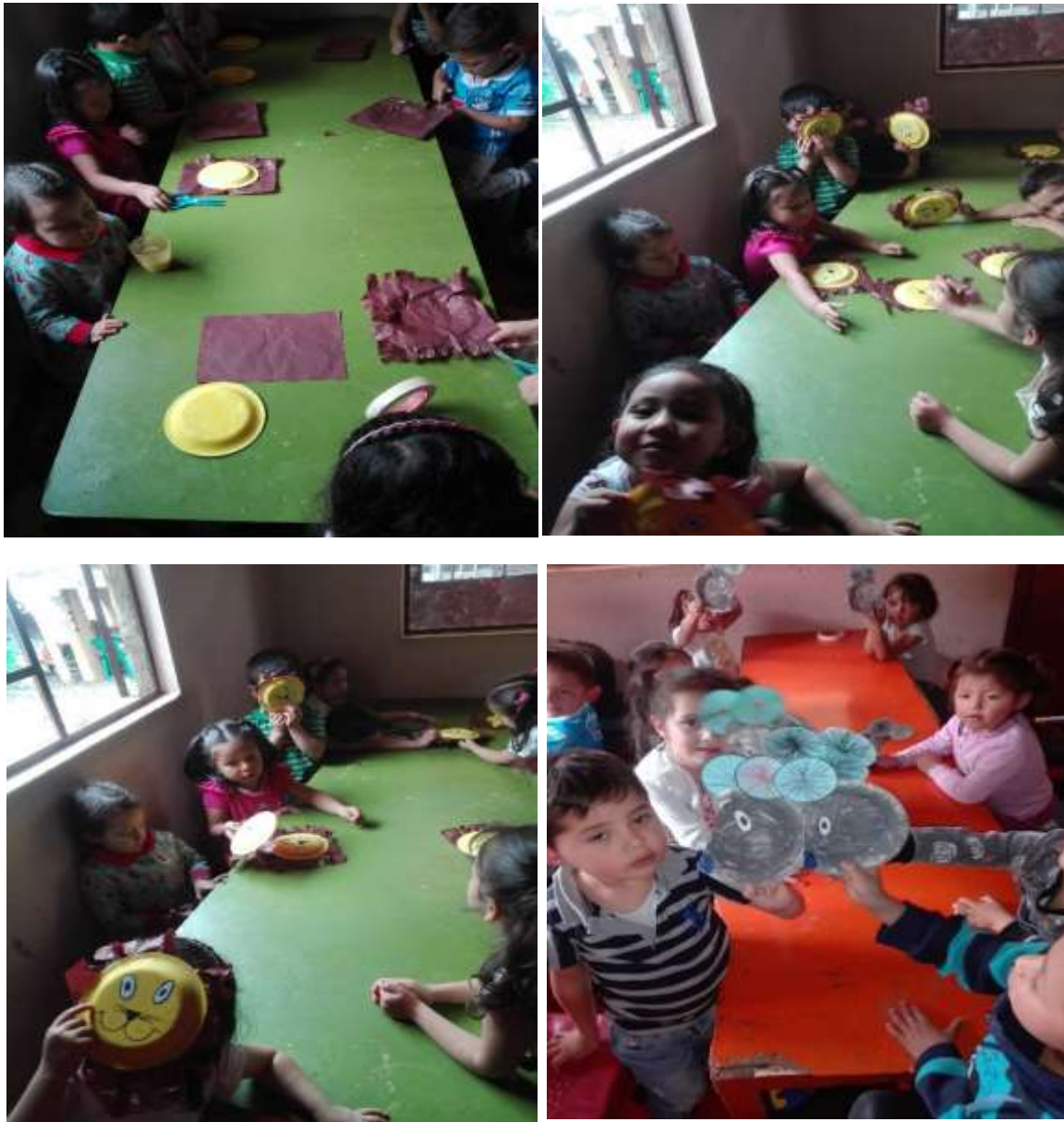
Figura 2: Evidencia Fotográfica Taller#1

comieron un postre y con los platos pudieron hacer la actividad donde el niño muestra una comparación con su personalidad. Siendo un trabajo de descubrimiento como dice Montessori el niño se desarrolla conociendo su entorno a medida que se enfrenta al ambiente va aprendiendo a manejar los residuos sólidos lo cual muestra que fue una actividad enriquecedora.