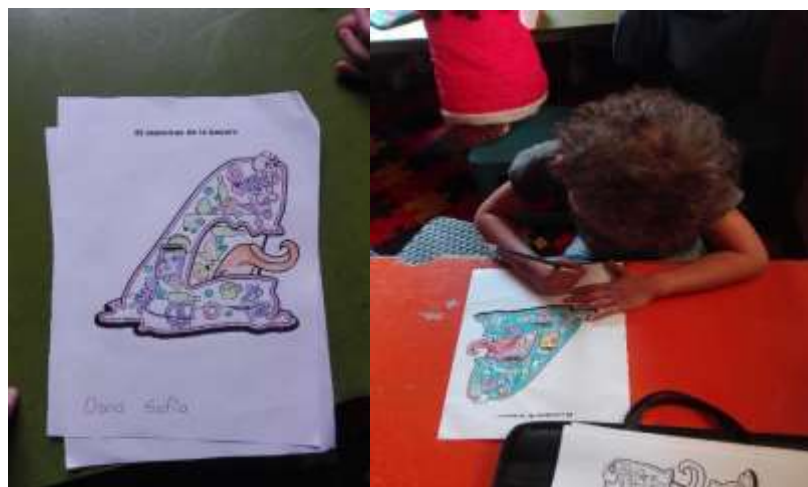
Figura 6: Evidencia Fotográfica Taller#6.

En la sesión 6 (Diario N°6, Anexo N° 15 ), es una buena conclusión después de varias manualidades enseñar el manejo de los residuos sólidos con el cuento del monstruo de la basura donde la defensa civil tiene aporte importante al explicarle a los niños lo que ellos hacen por la naturaleza y el medio ambiente. Incentivando a los niños a reciclar y la importancia que tiene cuidar el medio ambiente ya que van a tener al frente de ellos una figura de autoridad la cual le dará un ejemplo adecuado. Galeano (2018), muestra que en la educación es necesario que se diseñe herramientas para que la educación ambiental sea enriquecedora donde un agente publico les dé un ejemplo de vida a los niños por lo cual es de gran importancia para que los niños se sientan motivados teniendo una experiencia pedagógica significativa.