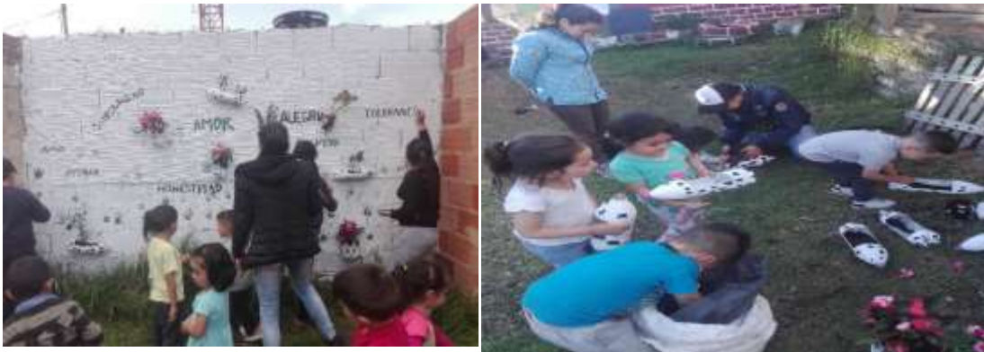
Figura 7: Evidencia Fotográfica Taller#8..

En cuanto a la actividad 7 y 8 (Diario N°7, Anexo N° 16 y Diario N°8, Anexo N°17 ), fue de vital importancia trabajar con los padres de familia y los niños con el mural donde ellos lo adornaron con plantas del jardín dando ejemplo a los niños y mostrando una sana actividad a favor del medio ambiente. Además, aporta a los niños tranquilidad y paz al tener una responsabilidad como cuidar una planta, el niño sentirá compromiso y dedicación con el contexto que se está desarrollando. Malaguzzi (2001) muestra que los niños pueden explorar por medio de la manipulación, observación, experimentación, donde los niños interactúan con los padres para desarrollar estas dos actividades y se conectan como familia por medio de la fundación lo cual fue un gran aporte para el desarrollo integral del niño se denoto compromiso, cuidado y delicadeza con la naturaleza.